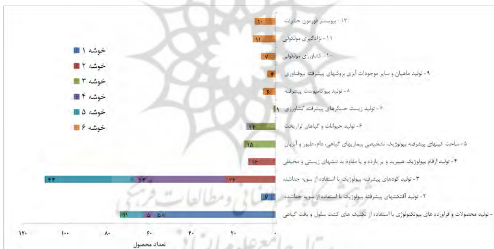
نمودار (2) توزیع تعداد محصولات در خوشه ها به تفکیک زیر دسته های فناوری Chart (3) Distribution of products in clusters by technology subclasses