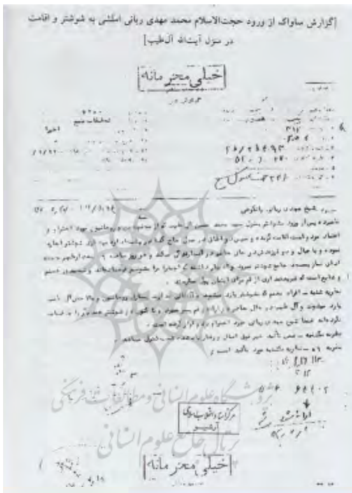
(اسدی، ۱۳۹۳، ص ۲۹۸)