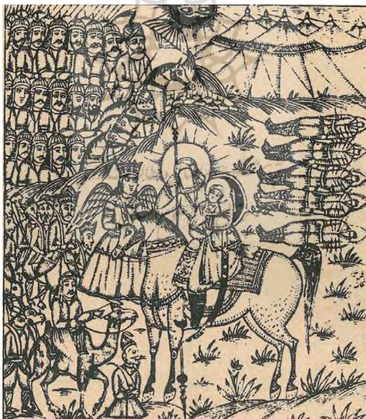
تصویر ۶: جوهری، (۱۳۰۳ق).