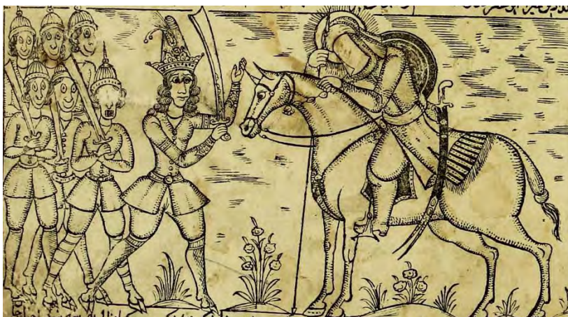
تصویر ۵: جوهری، (۱۲۹۲ق)