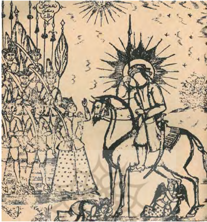
تصویر ۳: جوهری، (۱۲۷۰ق)