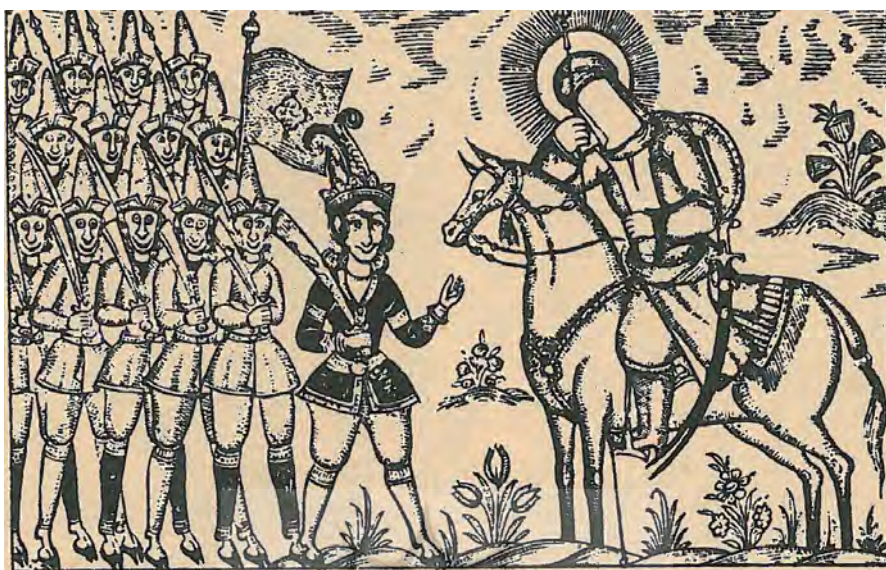
تصویر ۱: جوهری، (۱۲۷۲ق) (ب).