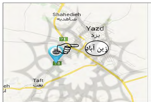
تصویر ۱. نقشه هوایی از روستای زین آباد ۲

زین آبادی که گونه‌ای از زبان زرتشتیان یزد است، ۱۹۰ گویشور دارد و مردم زین آباد به آن تکلم می‌کنند. ۲ زین آباد، روستای کوچکی با قدمت ۴۰۰ سال است و سرراه اصلی یزد و در ۱۰ کیلومتری جنوب باختری یزد به تفت، در ارتفاع ۱۴۰۰ متری قرار گرفته است. روستای زین آباد در یک منطقه میان کوهی واقع شده و آب و هوای معتدل خشک دارد. موقعیت جغرافیایی این روستا در تصویر ۱-۱ قابل مشاهده است.