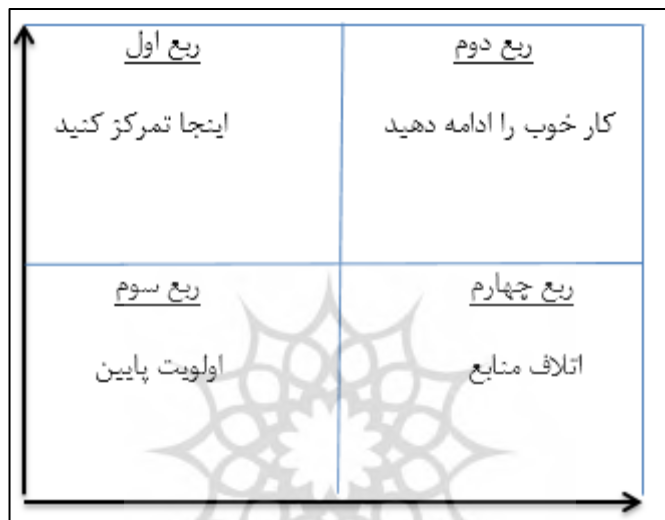
شکل (۲) - تحلیل عملکرد-اهمیت ماتریس دوبعدی

ربع اول (اینجا تمرکز کنید). مشخصه‌های ادراک‌شده برای پاسخ‌دهندگان بسیار مهم هستند، اما سطح عملکرد به نسبت پایین است. این ربع ضعف اساسی سازمان را نشان می‌دهد، بنابراین نیازمند توجه فوری برای بهبود است. نکته اساسی این است که ناتوانی برای شناسایی مشخصه‌ها در این ربع، موجب رضایت پایین مشتری می‌شود. در حقیقت تلاش برای بهبود باید در بالاترین اولویت قرار گیرد؛ زیرا ضعف اساسی در این ناحیه است.