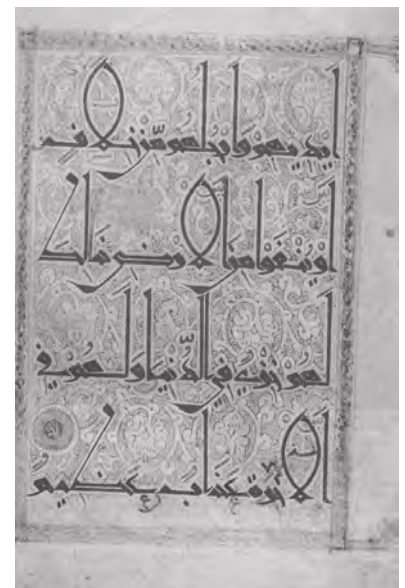
تصویر ۲: صفحه‌ای از قرآن کریم، به خط کوفی، سده پنجم، موزه هنرهای اسلامی برلین مأخذ: (شیمل، ۱۳۷۹: ۱۹۶).

سومین استاد بزرگ ایرانی که در نوشتن خط ثلث و نسخ مهارتی بی‌بدیل داشت، ابوالمجد جمال‌الدین یاقوت بن عبدالله مشهور به «یاقوت مستعصمی» و ملقب به «قبة‌الکتاب» (وفات ۶۹۷ ه.ق) بود. وی برجسته‌ترین خوشنویس قرن هفت هجری بود که اعتبار پردازش «اقلام سته» به او داده شده است. گفته می‌شود شش شیوه قلم مدور یاقوت که معمولاً در جفت‌هایی از قلم جلی و خفی (ثلث و نسخ، محقق و ریحان، توقیع و رقا) مرتب شده‌اند، به شش پیرو او رسیده و تا به امروز به عنوان شیوه‌های عمده کتابت قرآن و متون عربی باقی‌مانده است (بلر، ۱۳۸۴: ۱۰۳). عبدالله صیرفی، مبارک شاه بن قطب، ارغون الکاملی، احمد بن السهروردی، محمد بن حیدر الحسینی و پیر یحیی صوفی از خوشنویسان برجسته‌ای هستند که نقش مؤثری در ترویج شیوه خوشنویسی یاقوت ایفا کردند هنر یاقوت در بغداد با حمایت مغولان به اوج شکوفایی رسید (همان).