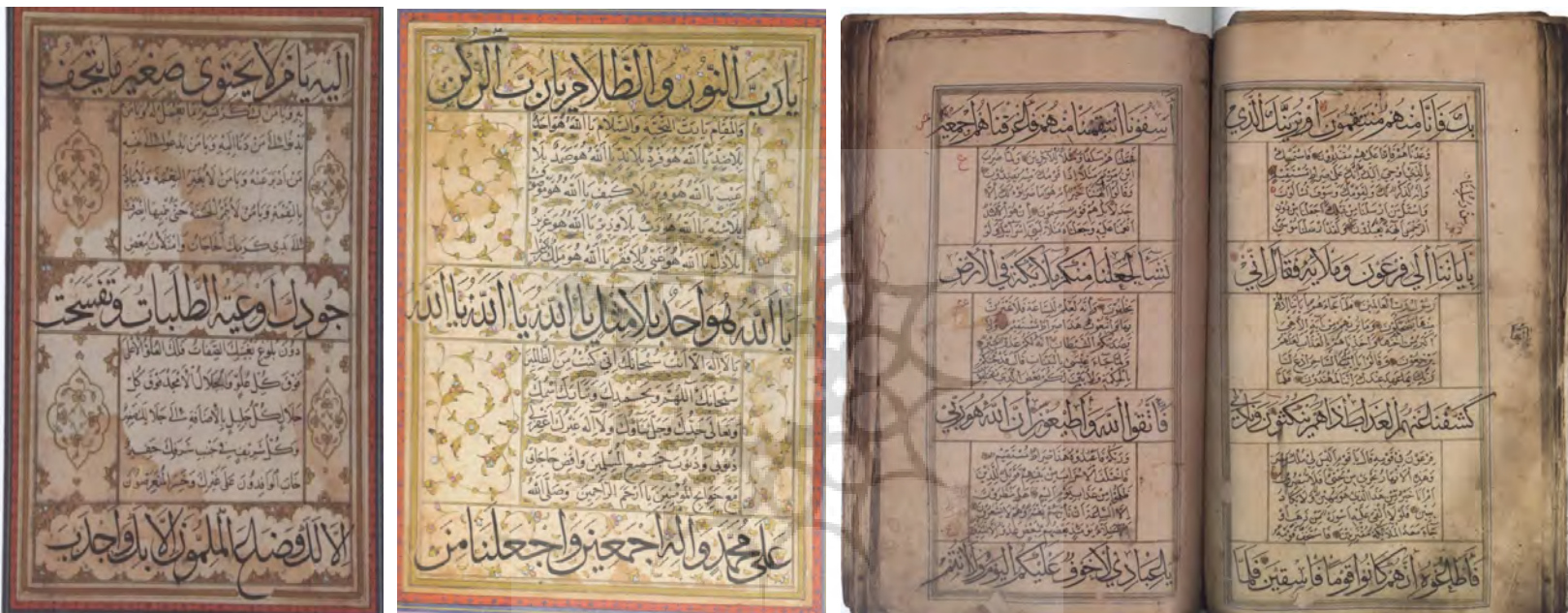
شماره ۱۰ از کتاب «تصاویر و مطالعات فنی» به بیننده القا شده است.

و هفتم با خط جلی و واحدهایی که در میان آن‌ها قرار گرفته با خط خفی کتابت گردیده است که نتیجه آن ایجاد نوعی تنوع دلپسند و زیبا در شیوه نوشتار می‌باشد. این صفحه‌ها تذهیب و حاشیه ندارند و صفحه‌آرایی بسیار ساده‌ای دارد. علامت فصل هر آیه با دایره‌ای ساده مشخص شده است. ویژگی‌های ظاهری این قرآن بر خلاف سایر قرآن‌های تیموری که دارای تزئینات بسیار مفصل و پیچیده بود، از هر نوع آرایه‌ای مبرا است که نوعی زیبایی ساده و اصیل را به نمایش می‌گذارد. در این دست نوشته، بیان اصلی متن از طریق وضوح و تأثیر گذاری شیوه نگارش و خوشنویسی