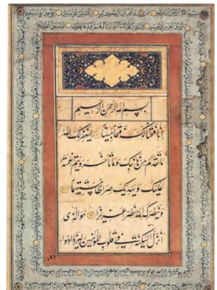
تصویر ۵: صفحه‌ای از یک مجموعه آیات قرآن کریم، به خط شاه محمود نیشابوری، قرن دهم، مأخذ: (خلیلی، ۱۳۷۹: ۹۷).

بیش تر تذکره‌نویسان مهارت خواجه شهاب الدین عبدالله را در خوشنویسی ستوده‌اند. چنانکه در تاریخ رشیدی نیز ضمن اشاره به این نکته آمده، خط نستعلیق را پس از سلطان محمدنور