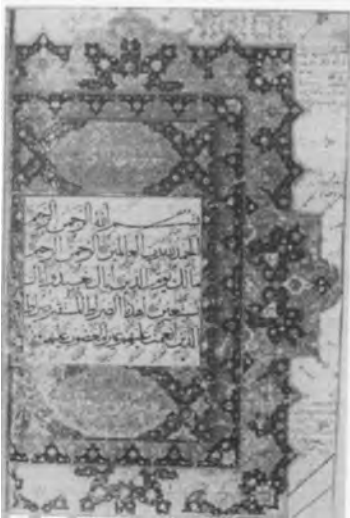
تصویر ۶: صفحه‌ای از قرآن کریم، به خط خواجه عبدالله مروارید، گنجینه قرآن، مأخذ: (شایسته‌فر، ۱۳۸۸: ۱۰۸).

در مورد شیوه نوشتار و نوع این نسخه، از جانب محققان و نسخه‌شناسان، اظهار نظر صریحی صورت نگرفته اما این نسخه نمونه‌هایی از خطوط ثلث، محقق و نسخ را با خود به همراه دارد. صفحات این قرآن دارای جدول کشی است و آیات کلام الله در فواصل میان آن‌ها در نوزده سطر به صورتی بسیار منظم به رشته تحریر در آمده است. این روش ترکیب‌بندی که در گذشته برای نگارش قرآن کریم و ادعیه مورد استفاده قرار می‌گرفت، مبنی بر استفاده از خطوط متنوع برای ایجاد زیبایی بیشتر در کتابت بود. جهت دستیابی به نتیجه بهتر هنرمند، قسمت‌های مختلف متن را به صورت یک در میان، به نوارهای پهن و باریک تقسیم کرده، قسمت‌های اول، سوم، پنجم