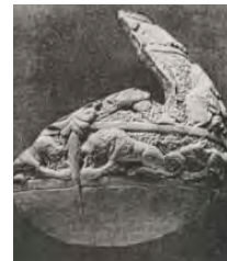
تصویر ۱۱: (Wilkinson, ۱۸۹۷, ۲۷۸۴)

ایران، نیشابور یا مازندران، قرن دهم و یازدهم میلادی (مورگان، ۱۳۸۴، ۱۰۰)