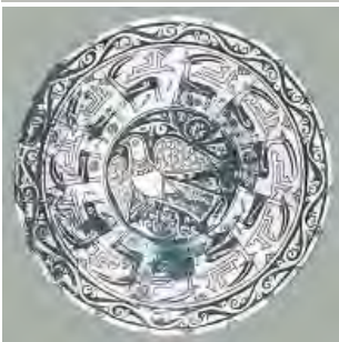
تصویر ۱۴: ایران، نیشابور، تپه مدرسه (Wilkinson, ۱۸۹۷, ۴۶)