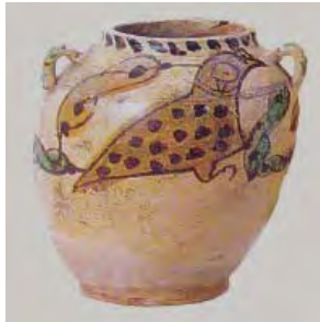
تصویر ۱۳: ایران، احتمالاً منطقه ی مازندران، قرن دهم و یازدهم میلادی (مورگان، ۱۳۸۴، ۹۹)