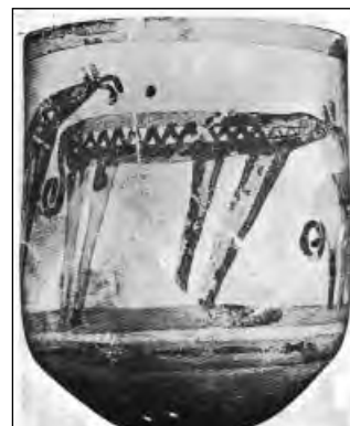
تصویر ۳: ظرف اندازه گیری (کیل) ۴۰۰۰ قبل از میلاد