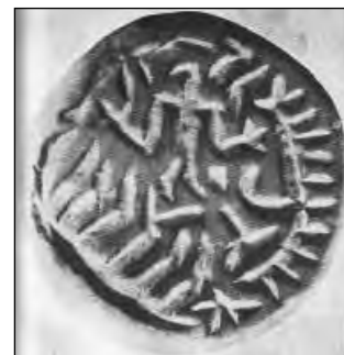
تصویر ۸: مهر اواسط هزاره چهارم ق.م