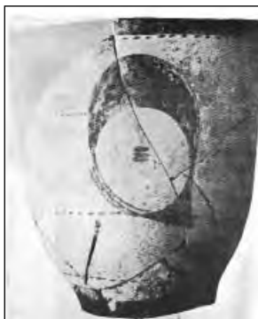
تصویر ۶ کاسه گود نیمه اول هزاره چهارم ق.م