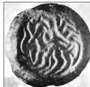
تصویر ۹: مهر اواسط هزاره چهارم ق.م