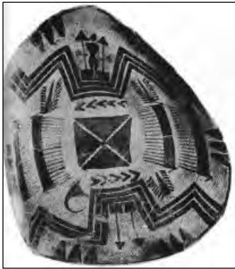
تصویر ۴ ظرف تو گود اواسط هزاره چهارم ق.م منبع تصویر: تاریخ عیلام (پیر آمیه)