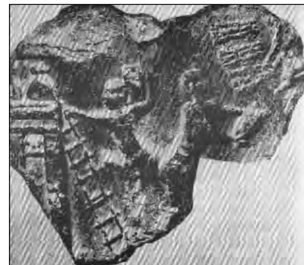
تصویر ۱۲: اثر مهر استوانه‌ای نیمه دوم هزاره چهارم ق.م