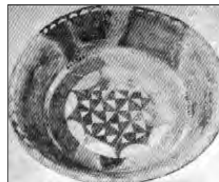
تصویر ۱: بشقاب تو گود اواخر هزاره پنجم ق.م