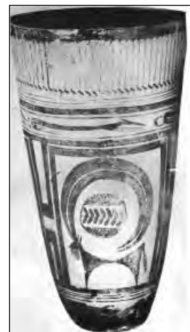
تصویر ۷: ظرف اندازه گیری اواسط هزاره چهارم ق.م