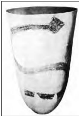
تصویر ۵ ظرف انداره گیری اواسط هزاره چهارم ق.م