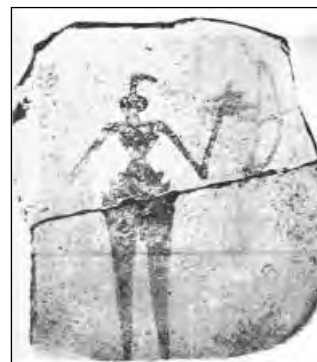
تصویر ۲: مرد کماندار اوایل هزاره چهارم ق.م منبع تصویر: کتاب تاریخ عیلام (پیر آمیه)