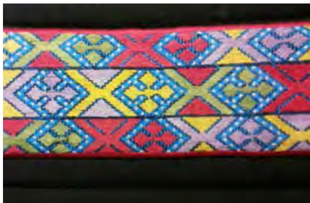
تصویر ۵. نمونه ای از نقوش قرینه سوزن دوزی بلوچ. عکس: گلناز کشاورز، ۱۳۹۵.