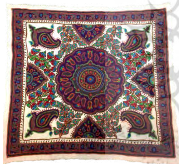
تصویر ۷. نمونه ای از پته دوزی کرمان.