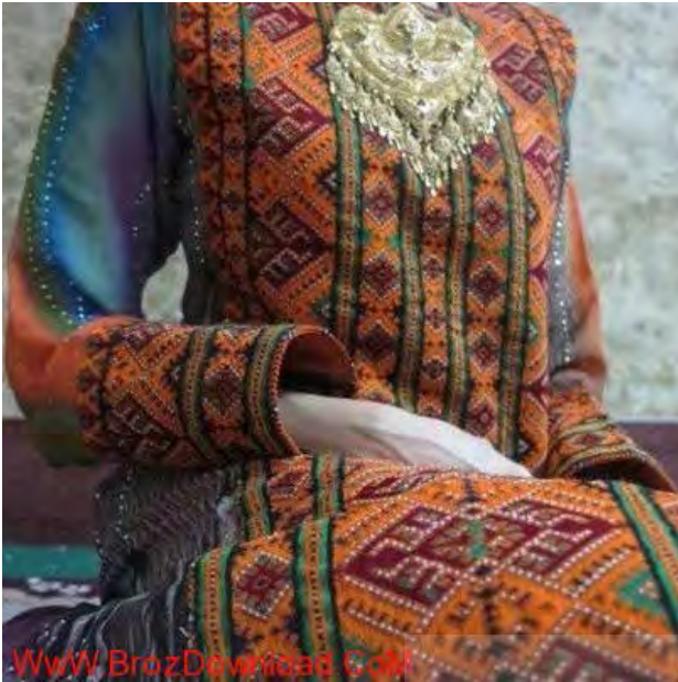
تصویر ۲. نمونه ای از پوشاک زنانه بلوچ.