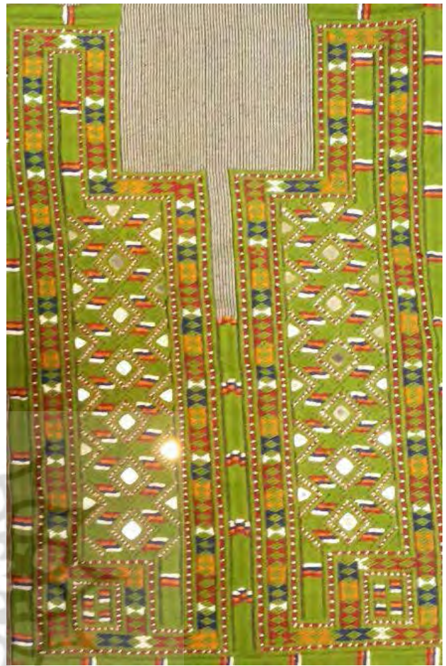
تصویر ۳. رنگ‌های سنتی نمونه‌ای از قطعه پیش‌سینه سوزن‌دوزی بلوچ

مدت‌های بسیار طولانی‌ای از یکجانشین شدن قوم بلوچ می‌گذرد. اما همچنان در بسیاری از خانه‌های روستایی سیاه چادرهای بلوچی برپاست و نقوش هندسی مربوط به پیش از یکجانشینی همچنان در هنر بلوچ‌ها و از جمله در سوزن‌دوزی بکار می‌رود. (تصویر ۶) نمادین و تجربیدی بودن نقوش، عاملی مشترک در میان هنر تمام اقوام عشایر ایران محسوب می‌شود. زندگی عشایر ابتدایی‌تر از یکجانشینی محسوب می‌شود. نقوش هندسی نیز نسبت به نقوش طبیعت‌گرا که خطوط نرم در آن بکار می‌رود مقدماتی است. در بررسی سیر تحول تاریخ هنر نیز در شکل‌گیری هنرهای تصویری ابتدا ارجحیت با اشکال هندسی بوده است. رفته رفته اقامت دائم در شهرها سبب گرایش به نقوش نرم‌تر می‌شود. به عنوان نمونه در پته کرمان که از نظر جغرافیایی و ارتباطات فرهنگی، نزدیکی زیادی با قوم بلوچ دارند، به دلیل سابقه شهرنشینی طولانی از نقوش گیاهی و طبیعت‌گرا و مملو از خطوط نرم استفاده می‌شود. گرایش به این نوع نقوش ضرورت استفاده از پارچه با تار و پود مشخص و عمود بر هم را که در سوزن‌دوزی بلوچ مرسوم است از بین برده است. در پته کرمان به صورت سنتی از پارچه‌های کج راه