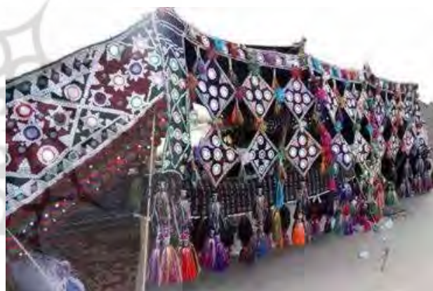
تصویر ۶. نمونه ای از سیاه چادر بلوچی.