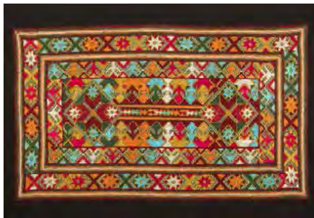
تصویر ۴. نمونه نقوش سوزن دوزی بلوچ ملهم از طبیعت موسوم به اشک عروس.