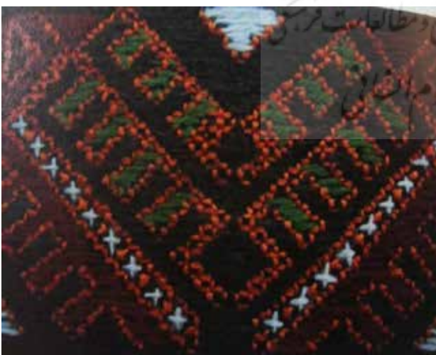
تصویر ۴ ب. نمونه نقش حیوانی سوزن‌دوزی بلوچ موسوم به دم طاووس.