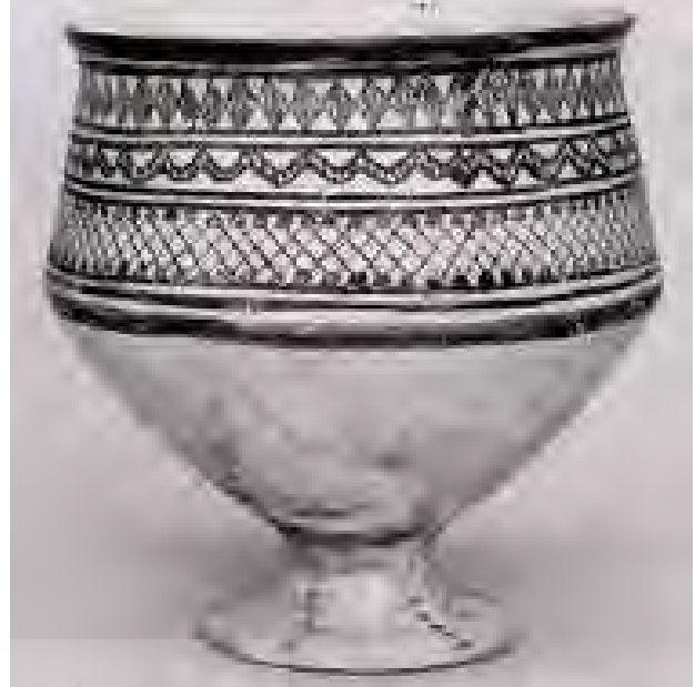
تصویر ۱. نمونه ای از سفال فلات مرکزی ایران با نقوش هندسی مشابه نقوش سوزن دوزی بلوچ، هزاره چهارم قبل از میلاد.

طی آن «نگاره‌های مختلف بر روی پارچه‌های بدون نقش از طریق دوختن و یا کشیدن قسمتی از نخ‌های تار و پود به وجود می‌آید. رودوزی‌های سنتی باید علاوه بر جنبه زیبایی، کاربردی نیز باشند» (یاوری، ۱۳۸۹: ۱۱۱). رودوزی‌های سنتی کلاً به ۶ دسته تقسیم می‌شوند. «بلوچی دوزی و یا سوزن دوزی بلوچ در این تقسیم‌بندی شش‌گانه جزو انواع پرکار قرار می‌گیرد که در آن‌ها زمینه اصلی مشخص نبوده، دوخت و الوان موجب پیدایش زمینه تازه‌ای پر از نقش و نگار می‌شود» (یاوری، ۱۳۹۰: ۲۳). پرکار بودن و یا کم‌کار بودن سوزن دوزی و ظرافت نخ و هماهنگی رنگ‌ها نقش مهمی در ارزش آن دارد.