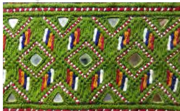
تصویر ۸. نمونه نقوش تجریدی سوزن دوزی بلوچ به همراه آینه کاری. عکس: گلناز کشاورز، ۱۳۹۵.