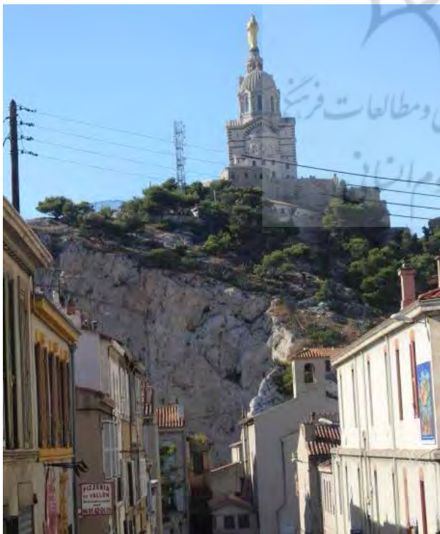
تصویر ۱ و ۲. کلیسای جامع نوتردام، ماری. عکس: مریم محسنی مقدم، ۱۳۹۴.

و متعدد آن سعی در ایجاد القای حس قدرت به مردم را داشت.