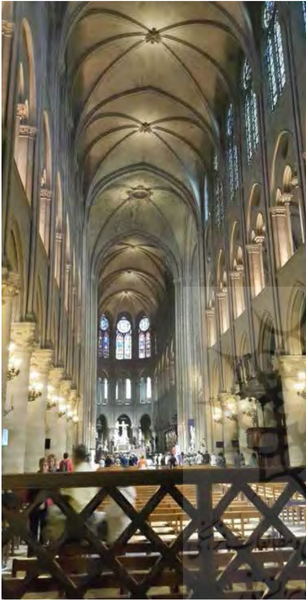
تصویر ۹. عمود گرایی فضای داخلی در کلیسای نوتردام پاریس عکس: مریم محسنی مقدم، ۱۳۹۴.