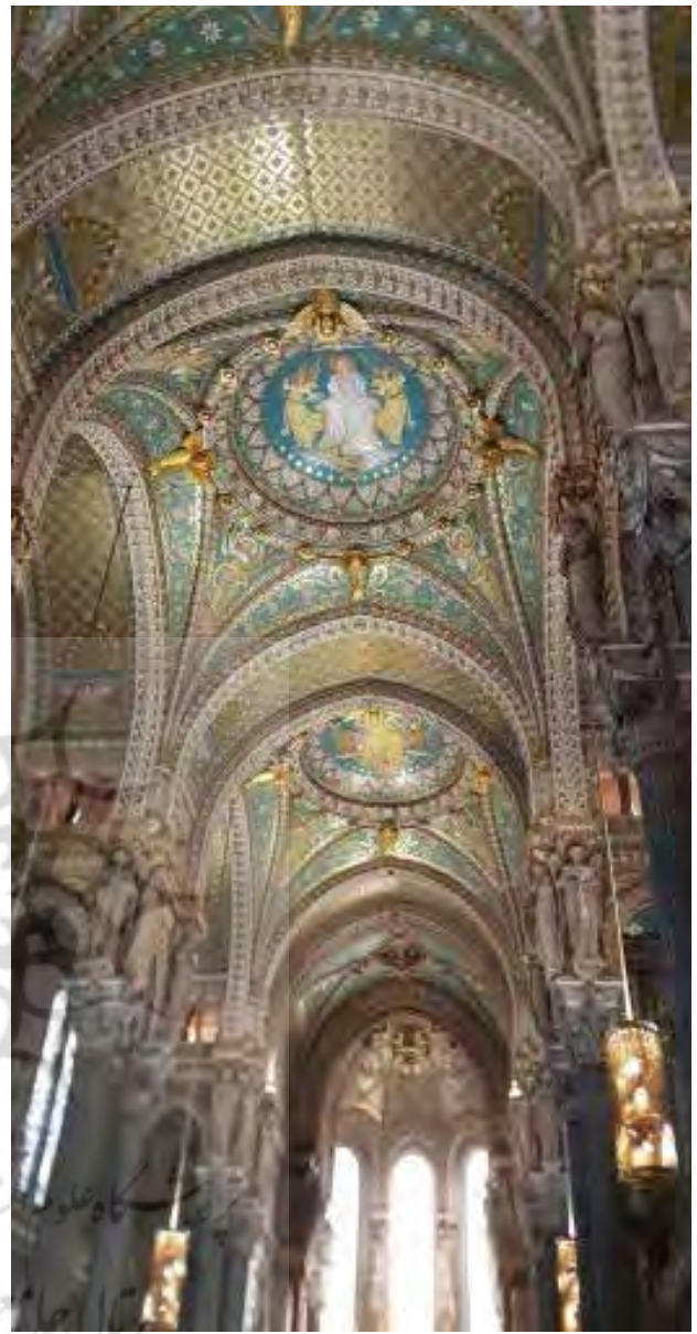
تصویر ۸. تزئینات سقف کلیسای نوتردام لیون عکس: مریم محسنی مقدم، ۱۳۹۴.

عبادی و آواهای انسانی در هنگام نیایش دسته جمعی را عامل موثر در معنویت فضای کلیساها دانستند. در مقابل، برجسته ترین عنصر فضایی که باعث دور کردن انسان از عالم معنا، روحانیت و مادی گرایی در این فضاها می شود؛ از نظر ۵۰ درصد افراد مجسمه ها و پیکرتراشی های درون کلیسا است، ۳۸ درصد به تراکم و تنوع تزئینات کلیسا اشاره کردند و در رتبه بعدی ۲۳ درصد نقاشی های کف و نقاشی های دیواری را عامل موثر در دور کردن انسان نیایشگر از عالم معنوی و روحانی می دانستند.