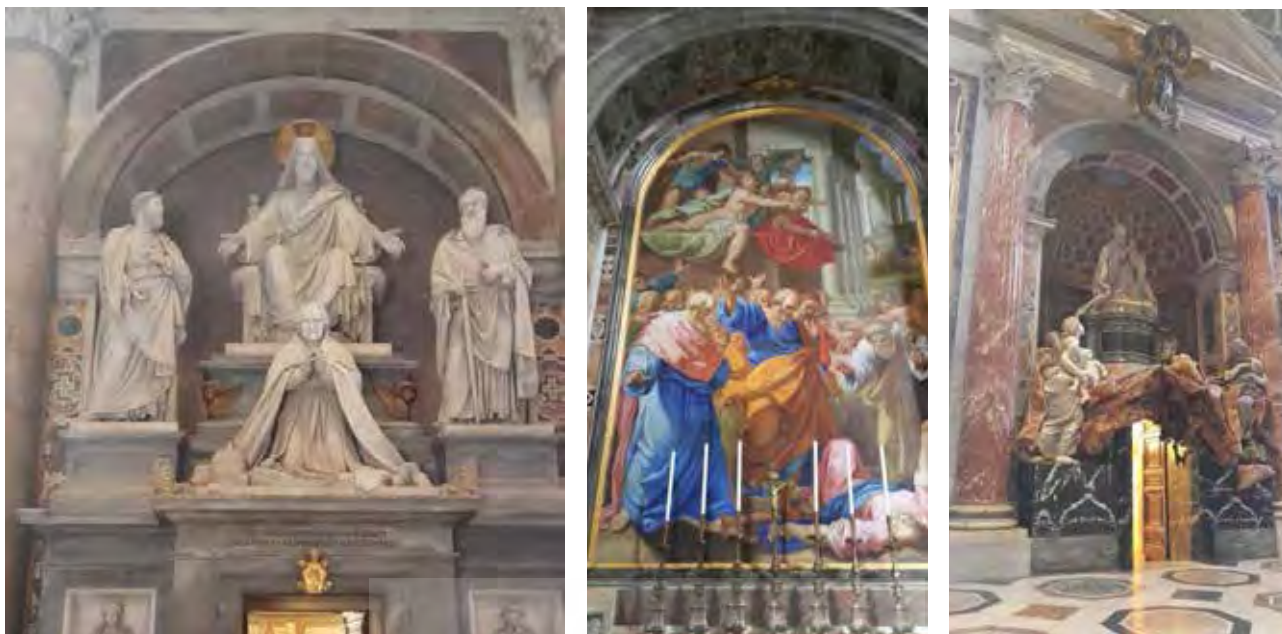
تصویر ۷. نقاشی دیواری و مجسمه های کلیسای سن پیترو در روم. عکس: مریم محسنی مقدم، ۱۳۹۴.

فضای داخلی کلیساهای غربی و ارتفاع زیاد آن به نوعی بر حس عروج و تعالی تأکید می کند و از طرفی انسان قرار گرفته در این فضا با دیدن عظمت و بلندای فضای درونی که به دور از تناسبات انسانی است، دچار احساس خوف و سرگشتگی می شود. «برای اندیشیدن و تفکر، دو شیوه عمودی و افقی بازشناخته می شود. در نگاهی کلی، منطق با تفکر عمودی، در «کنترل» ذهن و با تفکر افقی، در «خدمت» ذهن است. تفکر عمودی به واسطه طبیعتش، نه تنها در تراوش ایده های نو کارایی ندارد بلکه کاملاً محدود کننده است» (دیبونو، ۱۳۷۶: ۲۴). قرار گرفتن طاق ها و گنبد های داخل کلیسا در ارتفاعی بسیار زیاد برای انسان نیاشگر حس عدم امنیت فضایی را ایجاد می کند. ذهن عبادت کنندگان در کنترل نظام عمودی حاکم بر کلیسا قرار می گیرد و آنها خود را در سیطره فضایی عظیم، بلند و دست نیافتنی می یابند. انسان با ورود به این فضا، احساس حقارت در برابر نیرویی عظیم می کند که توسط معماری آن بنا ایجاد می شود، که البته این احساس در نوع خود می تواند باعث به یاد آوردن خدای متعال شود چرا که ما خالق هستی را گاهی از خوف و گاهی رجا یاد می کنیم (تصویر ۹).