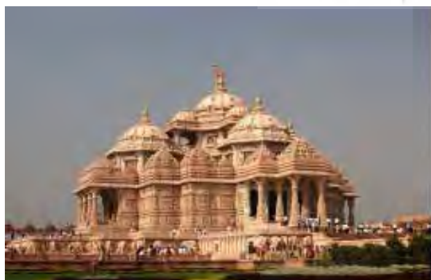
تصویر ۲. استقرار معبد آکشاردام منفک از بافت پیرامون. عکس: لیلا سلطانی، آرشیو پژوهشکده نظر، ۱۳۹۱.

معبد کلان‌مقیاس آکشاردام نمود عزم دولت‌مردان و مدیران