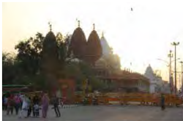
تصویر ۱. هم‌جواری فضاهای مذهبی ادیان مختلف در خیابان چندی‌چوک. عکس: لیلا سلطانی، آرشیو پژوهشکده نظر، ۱۳۹۱.

این معبد کلان‌مقیاس به‌عنوان مؤلفه‌ای عینی در منظر مصنوع دهلی که به‌واسطه ویژگی‌های کالبدی شاخص خود، صرفاً واجد مؤلفه‌های یک نشانه شهری است، در فرایند برنامه‌ریزی منجر به ایجاد یک فضای جمعی نشده و فرانمودی مبنی بر دخالت دولت و سیاست‌های حزبی بر الگوی استقرار و رویکرد حاکم بر بهره‌گیری از فضای مذهبی دارد. چنین دخالت‌هایی ضمن تضعیف حوزه