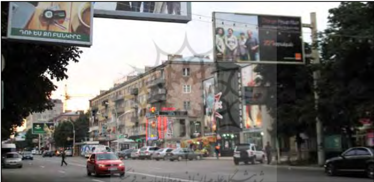
تصویر ۶. فضای جمعی مقابل شورای شهر کوتائسی. رویکرد نوگرا در طراحی میلمان شهری. مأخذ: مولود شهسوارگر، آرشیو مرکز پژوهشی نظر، ۱۳۹۲.

تصویر ۵. خیابان اصلی شهر وانادزر، خیابان تی‌گیرانمتس. همشینی دو رویکرد متفاوت در ساماندهی خیابان، که در هر دو زندگی شهری شهروندان کم اهمیت شمرده شده است. عکس: مولود شهسوارگر، آرشیو مرکز پژوهشی نظر، ۱۳۹۲.