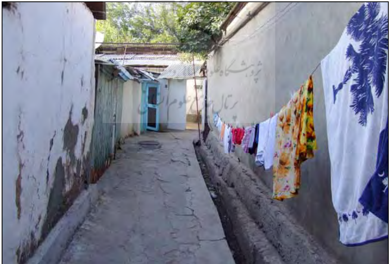
تصویر ۲. محلات پنهان در پشت جداره خیابان‌های سوسیالیستی. دوشنبه، تاجیکستان. پشت محلات خیابان رودکی. عکس: محمد آتشین‌بار، آرشیو مرکز پژوهشی نظر، ۱۳۹۰.