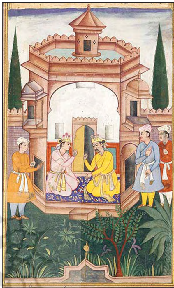
تصویر ۳الف. برگی از رزم‌نامه.

تصاویر ۳. حضور نمادین حوض در نگاره‌ها بر روایت موضوع نگاره در بستر باغ دلالت دارد.