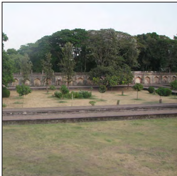
تصویر ۴ب. باغ مقبره بی بی کا. اورنگ آباد. عکس: پدیده عادلوند، ۱۳۹۱.