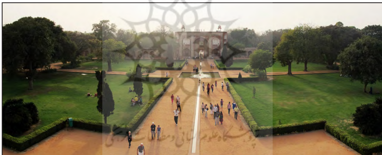
تصاویر ۴. توزیع پراکنده گیاه در باغ هندی و حضور نمادین آن در محور اصلی باغ نشان از عدم تعامل باغ هندی با طبیعت دارد.

عنصر معماری: عنصر کوشک که در باغ‌های ایرانی از جایگاه ویژه‌ای برخوردار است در باغ‌های هندی با وجه غالب مقبره نمود پیدا می‌کند به طوری که گونه باغ مقبره شاخص باغسازای هندی دوره گورکانی می‌شود. مقبره‌سازی به عنوان عنصر وارداتی از ایران در دستیابی گورکانیان به الگوی تسلط‌گرایی حتی در عالم پس از مرگ نقش مهمی بازی می‌کند. اهمیت بنای باغ با مرکز قرارگرفتن، ابعاد بسیار بزرگ و همچنین قرارگیری روی سکو که دسترسی مستقیم به آن را مانع می‌شود از جمله ویژگی‌های معماری تیموری است که با تفکرات گورکانی نیز همخوانی دارد و در باغ‌های آنها نیز نمود پیدا کرده است. به عبارتی، مرکزیت بنا نمادی از استبداد سیاسی دوره گورکانی است که بقیه جامعه تحت