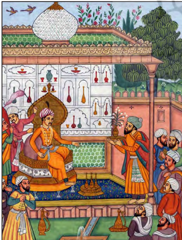
تصویر ۵ج. مجلس شاهانه در باغ.

لوای او قرار دارند. چنانکه باغ مظهری از بهشت است، حاکم نیز سایه خدا بر زمین است. به نقل از «اکبرشاه» آمده است همان طور که خدا یکی است و شریک ندارد، سایه خداوند بر روی زمین نیز باید یکی باشد (Kusar, 2006 به نقل از Tripathi, 1998). در طول حکومت سلسله گورکانی بر هند (فاصله قرون ۱۶ تا ۱۸ میلادی) نیز شاهد اهمیت این وجه از مفهوم باغ هستیم؛ باغ‌های هندی عظمت و قدرت امپراتوری گورکانی را حتی تا به امروز نیز نشان می‌دهند. با ورود به باغ‌مقبره‌های هندی ابهت بنا به قدری خودنمایی می‌کند که به مخاطب کمتر اجازه تأمل در محیط اطراف را می‌دهد. عظمت بنا اختلاف چشمگیری با دیگر عناصر موجود در مجموعه چون آب و گیاه دارد که نه تنها با آنها در تعامل نیست، بلکه آنها را وادار به نمایش ابهت خود می‌کند (تصاویر ۶). «کسروی» در مقاله خود تحت عنوان «دیدگاه کلاسیک و ارگانیک در مقبره‌سازی اسلامی هند» نظام باغ‌مقبره‌های هندی را کلاسیک می‌داند که یکی از نشانه‌های شاخص آن نظم هندسی است تا به واسطه آن تسط بر طبیعت را نشان دهند. به عبارتی نظامی دستوری بر آن حاکم است. توجه به کوشک در نگاره‌های گورکانی تاحدی است که شاخص این