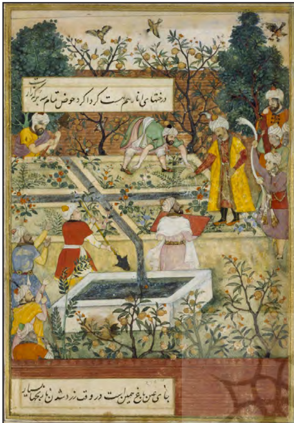
تصویر ۵الف. بابر در حال نظارت بر ساخت باغ وفا.