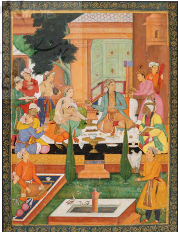
تصویر ۵ب. مجلس شاهانه در باغ.

تصاویر ۵. اگرچه در نگاره توصیفی از باغ توجه به پوشش گیاهی حداکثری است اما در دیگر نگاره‌ها که توصیف باغ مطرح نیست و تنها اتفاق موضوع نگاره در فضای باغ مدنظر است، عنصر گیاه یا نمایی نمادین دارد و یا در ورای دیوار باغ به تصویر کشیده می‌شود.