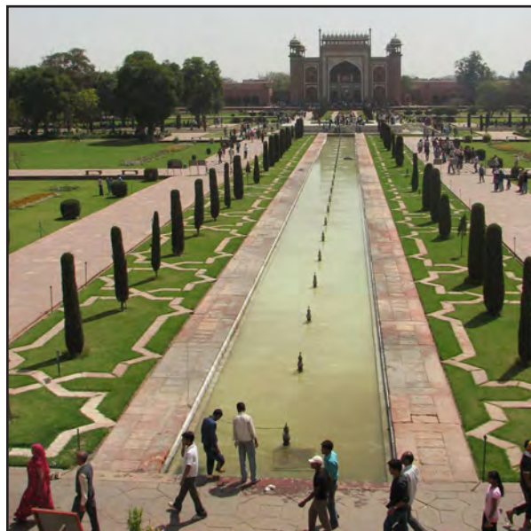
تصویر ۴الف. باغ مقبره تاج محل. آگرا. عکس: پدیده عادلوند، ۱۳۹۱.