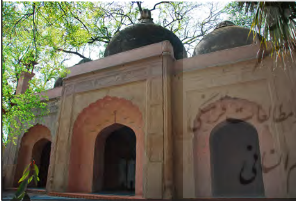
تصویر ۱۱. رنگ صورتی، سفید و سبز در مسجدی در جوار مجموعه قطب منار، دهلی، هند.

ایوان، فضایی دلنشین و آرامبخش ایجاد کرده است (تصویر ۱۱). گستردگی روابط با دیگر کشورها در الگوپذیری معماری و تزئینات و از جمله عنصر رنگ تأثیر داشته است. رنگ‌ها گاه برگرفته از معماری کشورهای اسلامی، تأثیر پذیرفته از رنگ‌های معابد هندویی و گاه ترکیبی از این دو است. ترکیب رنگ سبز و سفید مانند مساجد عربی در مسجدی در بافت شهری احمدآباد (تصویر ۱۲) و رنگ‌های سفید، سبز و آبی در حسینیه شهر لاکنو به چشم می‌خورد (تصویر ۱۳).