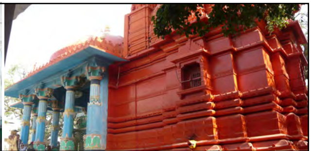
تصویر ۲. معبد برهما و تمثال وی. پوشکار، هند. عکس: شهره جوادی، ۱۳۹۱.