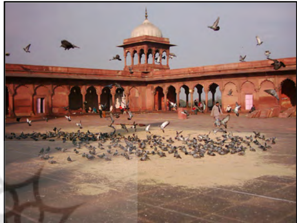
تصویر ۱۰. دو رنگ قرمز و سفید در مسجد جامع دهلی، هند. عکس: سیدامیر منصور، ۱۳۸۲.

توجه قرار گرفته و رنگ‌های پوششی جهت تزئین استفاده شده‌اند. از این جمله می‌توان به مسجد کوچکی در مجموعه قطب منار در جوار مسجد قوه‌الاسلام اشاره کرد که رنگ غالب این بنا صورتی و سفید است. سادگی و بی‌پیرایگی این مکان مقدس در شبستان و ایوان با پوشش رنگی سبز و صورتی و هماهنگ با درختان، گیاهان سبز، خاک باغچه و حوض کوچک مقابل