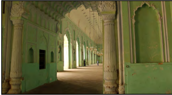
تصویر ۱۳. رنگ سبز، سفید و آبی در حسینیه لاکنو، هند. عکس: شهره جوادی، ۱۳۹۱.