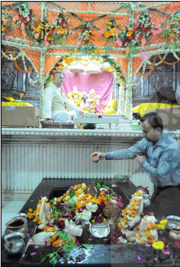
تصویر ۵. محراب معبد شیوا. دهلی، هند.

میلاادی است که در شهر دهلی خیابان چاندیچوک قرار دارد و تمثال شیوا در آن نگهداری می‌شود. رنگ غالب معماری آن سیاه و سفید بوده چنانکه در تمامی فضاهای داخلی و خارجی معبد، دیوارها و کف به رنگ سفید است. پارچه‌هایی به رنگ نارنجی نیز دیوارهای داخلی را تزئین کرده‌اند (تصویر ۵). محراب به رنگ سیاه که تندیس شیوا را با دو رنگ آبی و زرد در خود جای داده است (تصویر ۶). بنابراین دو رنگ متضاد سیاه و سفید در تمامی معبد دیده می‌شود؛ و سایر رنگ‌های معبد در تزئینات مجسمه‌ها و گل‌های رنگینی است که در محراب قرار دارند.