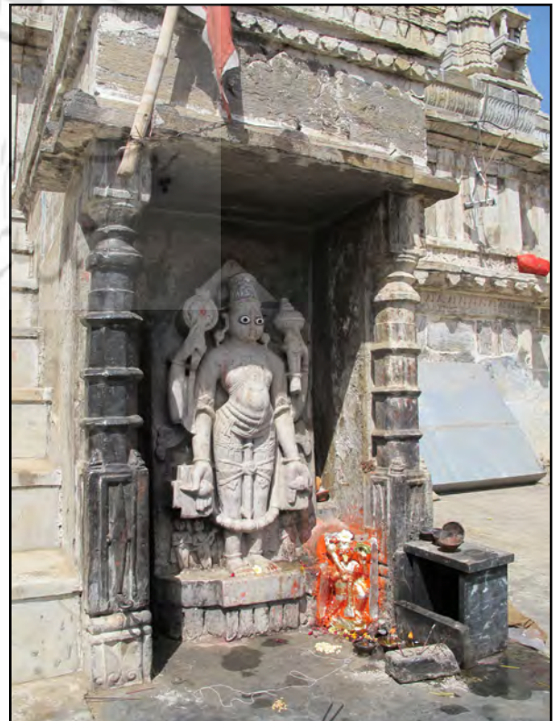
تصویر ۸. تمثال ویشنو در معبد جگدیش. عکس : شروین گودرزیان، ۱۳۹۱.