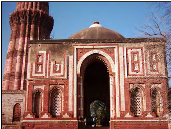
تصویر ۹. دو رنگ قرمز و سفید در مسجد قوه الاسلام. دهلی، هند. عکس : سیدامیر منصور، ۱۳۸۲.

گروه دوم (مساجد متأخر) مربوط به دوره های معاصر بوده که الگوی غالب آن ها دو رنگ است که معمولاً رنگ سفید در کنار رنگ دیگری چون سبز، صورتی و آبی به کار رفته است. تفاوت اصلی این بناها با گروه اول، پوشش رنگ بر مصالح اصلی است. این شیوه به جهت مصالح جدید و سهولت در ساخت و ساز مورد