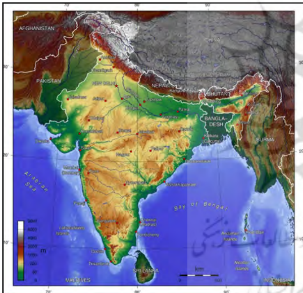
تصویر ۱. تنوع اقلیم در کشور هند.

سرزمین هند بیش از سه برابر ایران مساحت دارد و از حیث تنوع طبیعت با هیچ کشوری قابل مقایسه نیست. این شبه قاره پهناور به دنیایی تشبیه شده که در مناطق مختلف آن انواع آب و هوا، از آب و هوای به شدت گرم استوایی، تا سردترین و مرتفع‌ترین نقاط جهان را می‌توان مشاهده کرد. وجود انواع گیاهان گرمسیری و سردسیری در این سرزمین موجب تنوع بسیار در رنگ‌های طبیعی شده به نحوی که در اقسام پارچه‌ها می‌توان این رنگ‌ها را شاهد بود (تصویر ۱). تنوع رنگ در معادن کشور هندوستان نیز قابل توجه است. وجود انواع سنگ‌های رنگین موجب شده هیچ‌گونه محدودیت جدی در خصوص استفاده از مصالح ساختمانی با رنگ‌های مختلف وجود نداشته باشد. این امر به حدی است که به عنوان مثال از رنگ‌های خاصی نظیر رنگ کهربایی در طراحی کاخ کهربایی ۱ و رنگ صورتی در مجموعه شهر صورتی ۲ در شهر جیپور استفاده شده است (نفیسی، ۱۳۸۶: ۱۶۴-۱۶۱). بنابراین می‌توان ادعا کرد هندوان در بهره‌گیری از منابع طبیعی جهت دستیابی به انواع متنوع رنگ با محدودیت خاصی مواجه نبوده‌اند.