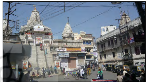
تصویر ۷. نمای معبد جگدیش، ادیپور، هند. عکس : شهره جوادی، ۱۳۹۱.

معبد جگدیش (Jagdish) در شهر ادیپور، متعلق به خدای ویشنو است که در قرن ۱۷ میلادی بنا شده است. در تمامی فضاهای خارجی و داخلی معبد، از دیوارها گرفته تا کف و سقف، رنگ سفید به کار رفته است (تصویر ۷). تنها محراب آن به رنگ سیاه (با تزئینات و پارچه های زرد طلایی) است. در اینجا نیز مانند معبد شیوا دهلی دو رنگ سیاه و سفید به کار رفته است. به نظر می رسد رنگ سفید در نمای خارجی و داخلی معابد گذشته از آنکه سنگی است که به سادگی در اقلیم یافت می شود، به جهت مفهوم آن که خلوص، صلح و آرامش را در پی دارد نیز انتخاب شده باشد و رنگ سیاه محراب شاید به لحاظ دفع نیروهای اهریمنی باشد که خدایان را در فضای سیاه جای داده اند (تصویر ۸).