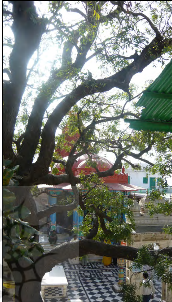
تصویر ۳. حیاط شطرنجی معبد برهما به دو رنگ سیاه و سفید. پوشکار، هند. عکس: شهره جوادی، ۱۳۹۱.

فضای پشت معبد، بنایی مکعب‌شکل قرار دارد که تماماً به رنگ زرد و گرداگرد آن راهرویی به منزله دالان طواف دیده می‌شود. متأسفانه امکان بازدید از داخل این مکان وجود نداشت (تصویر ۴).