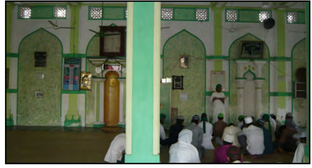
تصویر ۱۲. رنگ سبز و سفید در مسجد احمدآباد، هند. عکس: شهره جوادی، ۱۳۹۱.