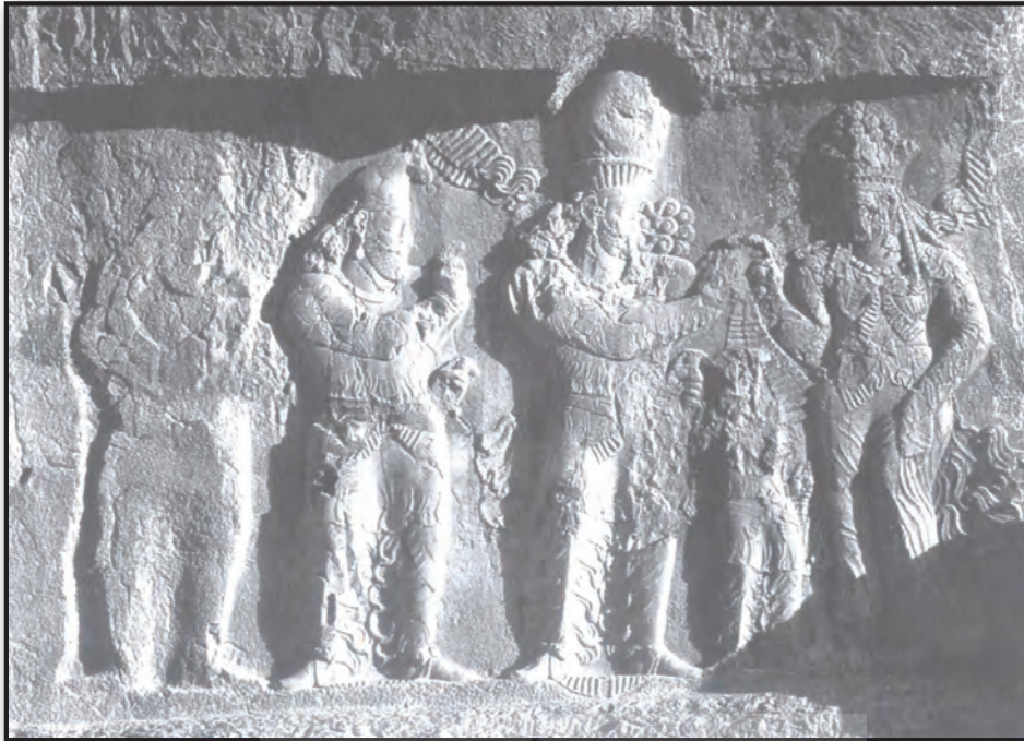
تصویر ۴. مراسم تاجگیری نرسی از ایزدبانو آناهیتا در نقش رستم، استان فارس، ایران.