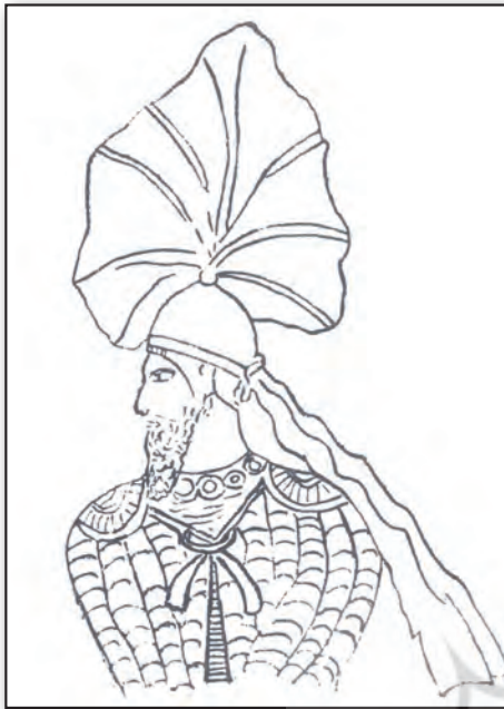
تصویر ۷. نماد فر ایزدی بر گردن پاپک پادشاه پارس و پدر اردشیر اول.