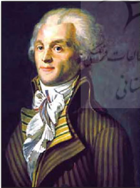
تصویر ۸. ب. پاپیون بر گردن ریسپیر، حقوقدان فرانسوی، قرن ۱۹.