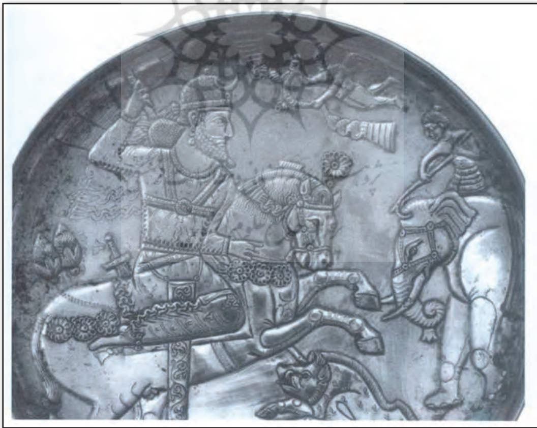
تصویر ۲: ظرف ساسانی با نقش یزدگرد اول در حال شکار (نوار موج که در سربند پارتیان بوده و معادل دیادم یونانی است در نقوش ساسانی زیاد استفاده شده است و علاوه بر نقش برجسته‌ها در سکه‌ها و ظروف نیز دیده می‌شود. گاه این فر ایزدی یا دیهیم توسط فرشته‌ای حمل می‌شود و به تاج یا گردن شاه آویخته می‌شود). مأخذ: Soudavar, ۲۰۰۳: ۱۵۵.

به یک گردش به شاهنشاهی آرد دهد دیهیم و طوق و گوشوارا در «فرهنگ معین» آمده است: دیهیم نوار مخصوصی بود که گرد تاج پادشاه ایران بسته می‌شد (معین، ۱۳۶۰ ج ۲: ۱۶۰۳). ردپای دیهیم را در آیین مهر و در زمان پارت‌ها می‌توان دنبال کرد؛ و آن سربند رشته مانند پارتیان است که معمولاً از آن به داهم/دادم (فارسی‌نو: دیهیم) یا معادل یونانی دیادم (Diadem) یاد می‌کنند. درحقیقت ظهور فرشته بالدار بر پشت سکه‌های پارتیان که دیهیمی را حمل می‌کنند معادل فرشته بالدار ساسانی است که نوار موج به عنوان فر ایزدی را با خود دارد (تصویر ۲). مهم‌تر از اینها چنین نقش‌مایه‌ای را پشت