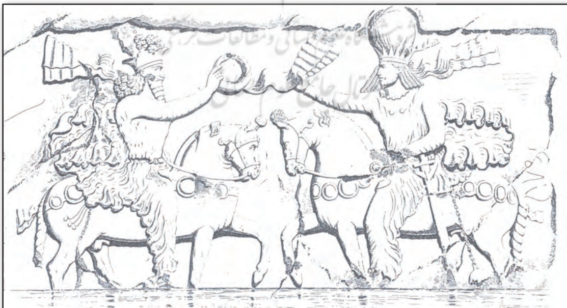
تصویر ۴. تاجگیری بهرام اول از اهورامزدا، تنگ چوگان، بيشاپور، استان فارس، ایران.

توسط اهورامزدا و یا ایزدان بزرگی مانند آناهیتا به فرمانروا اهدا می‌شود. در حقیقت با ایجاد این تصاویر، فرمانروایان ساسانی خود را نماینده و برگزیده اهورامزدا و ایزدان بزرگ آیین زرتشت در روی زمین می‌دانستند و این تصور را در بینندگان القا می‌کردند. در نقش تاج‌بخشی اهورامزدا به اردشیر اول (بنیان‌گذار سلسله ساسانی) در نقش‌رستم اهدای حلقه فرایزدی با نوارهای موج از سوی اهورامزدا درحالی است که نقش فر بر پیرامون تاج اردشیر و اهورامزدا نیز دیده می‌شود.