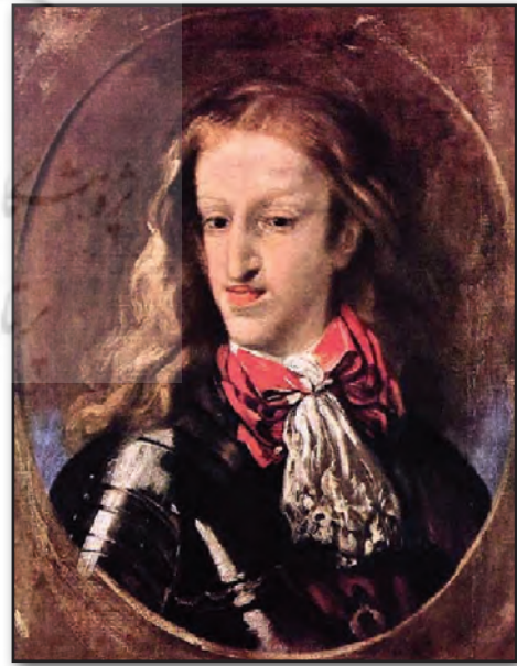
تصویر ۸. الف. پاپیون بر گردن چارلز دوم پادشاه اسپانیا، قرن ۱۷ میلادی.