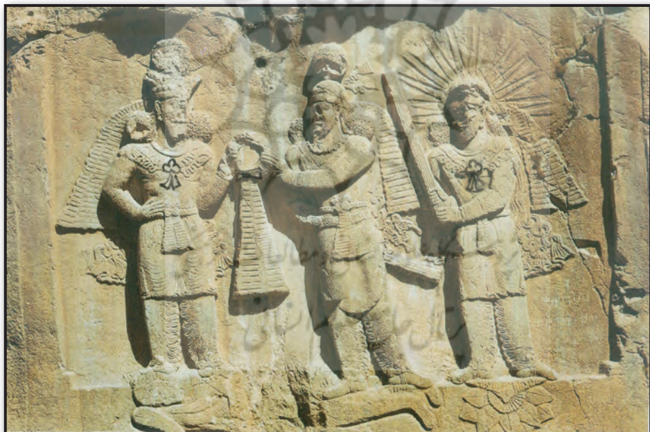
تصویر ۴. تاجبخشی اهورامزدا به اردشیر دوم در تاق بستان، کرمانشاه، ایران. پیش‌سینه، کمر بند و حلقه عهد و پیمان یا همان فر ایزدی با ریسمان موج با گره‌ای شبیه به پایون در دستان شاه و اهورامزدا آشکار است. مأخذ : جوادی و آورزمانی، ۱۳۸۸ : ۱۷۷.