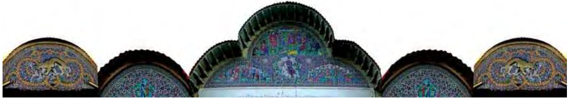
تصویر ۲. هلالی وسطی با ۳ مضمون بارگاه حضرت سلیمان، خسرو شیرین و یوسف و زلیخا، هلالی کناری آن نبرد خیر و شر و گرفت و گیر را به تصویر کشیده است.

نشاط و نوآوری در آنها موج می‌زند. (همان: ۵۲) در کاشی‌کاری سردر بناهای شیراز در دوره قاجاریه که اغلب هلالی شکل هستند، تحولی از لحاظ رنگ و موضوع در کاشی‌کاری پدید می‌آید و نقوش ایجاد شده بر روی کاشی سردرها با ابعاد بزرگ و همگی تحت تاثیر نقاشی‌های قاجاری و با الهام از «عکاسی قاجاری»، «چاپ سنگی» و «نقاشی قهوه خانه ای» بوده است.