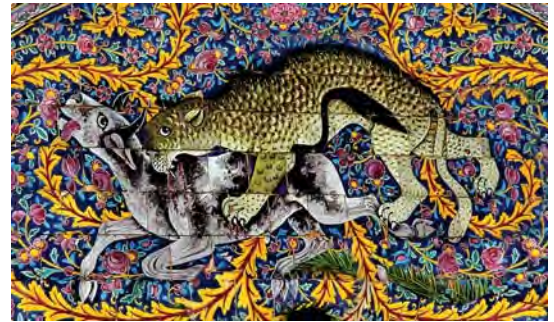
تصویر ۱۱. کاشی نگاره سردر عمارت باغ ارم با موضوع باستانی گرفت و گیر، مأخذ: همان

در دو طرف پیشانی عمارت قرار گرفته اند، صحنه جدال بین ببر و گاو را به تصویر کشیده است. تسلط و برتری نقوش اسلیمی درشت با رنگ زرد و سبز بر زمینه نقوش گیاهی و گل‌های ظریف و ریز زمینه غلبه ببر را تداعی می‌کند. (تصویر ۱۱ و ۱۲) این جدال احتمالاً برگرفته از صحنه نبرد شیر با گاو، یکی از نقوش برجسته‌های تخت جمشید است که به عقیده رومن گرشمن ۱ ، این نقش گویای تغییر فصول سال، از نیم سال سرد به به نیم سال گرم و به بیان دیگر بازگو کننده حلول بهار است. (تصویر ۱۳)