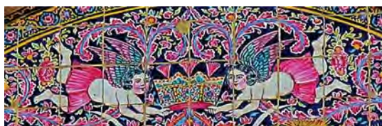
تصویر ۲۷. کاشی‌کاری هفت رنگ سردر خانه زینت الملک، تصویر دو فرشته بالدار با تاجی مزین به مروارید