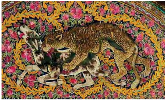
تصویر ۱۲. کاشی نگاره سردر عمارت نارنجستان قوام با موضوع باستانی گرفت و گیر