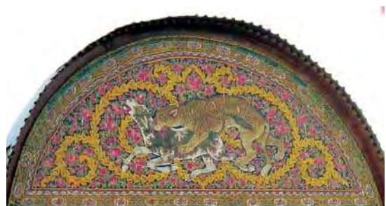
تصویر ۶. سردر عمارت نارنجستان قوام با نقش شیر و خورشید در هلالی وسطی و نقش اساطیری گرفت و گیر در هلالی‌های طرفین