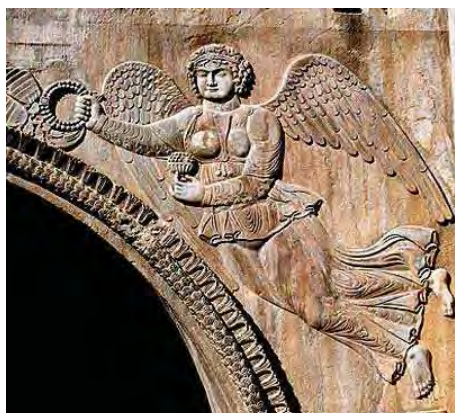
تصویر ۲۹. نقش برجسته طاق بستان با نقش الهه پیروزی یا فرشته بالدار