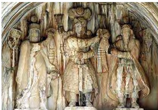
تصویر ۲۲. سنگ نگاره طاق بستان با نقش تاج شاهی و پرچم، تاج گذاری خسرو پرویز، دوره ساسانی، مأخذ: همان