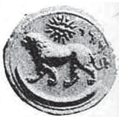
تصویر ۱۶. سکه ای متعلق به زمان پادشاهی داریوش سوم دوره هخامنشیان، مأخذ: جمال زاده، ۴۵-۱۳۴۴، ۶

در هنر و کیش هخامنشیان، شیر نماد میترا بوده و در آیین مهر پرستی نیز مقام ویژه ای داشته است. در دوره هخامنشی و ساسانی نقش شیر اهمیت ویژه ای داشته و برای نشان دادن قدرت و نیروی پادشاه اغلب او را در حال مبارزه و شکار شیر نشان داده‌اند. این نقش از دوره غزنویان به بعد گاهی در ترکیب با خورشید دیده می‌شود. به ویژه از دوره صفوی به بعد این ترکیب تصویری را بسیار می‌بینیم و در دوره قاجار به نشان رسمی دولت