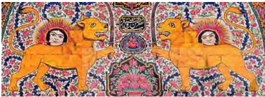
تصویر ۱۹. کاشی‌کاری سردر عمارت نارنجستان قوام با نقش شیر و خورشید، مأخذ: همان

نشان داده شده است. (شکوهیان و شیرازی، ۱۳۸۹: ۳۲) بنابراین می‌توان گفت: نماد شیر در دوره قاجار نسبت به دوره‌های قبل از خود از نظر معنایی و شکلی، دچار کمی استحاله می‌شود و معنای سیاسی و حکومتی آن، کاربردش را در سردر بناهای عمومی رواج می‌دهد.