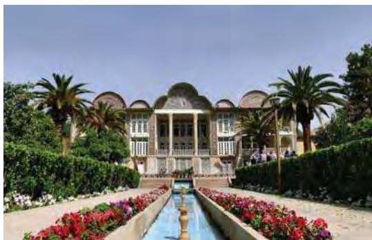
تصویر ۱. نمای روبرو از ضلع غربی باغ ارم، قاجاریه

قاجار، کاربرد شیوه کاشی هفت رنگ همراه رنگ آمیزی زیر لعاب روش غالب بوده است. (کاربونی و ماسویا، ۱۳۸۱: ۱۱) از خصوصیات مهم کاشی های زیر لعابی دوران قاجار تنوع رنگ، تنوع نقش ها، برجسته بودن و کاربردهای مختلف آن است. طیف رنگ‌ها گسترده بود و علاوه بر رنگ های استفاده شده در دوره های قبل، از رنگ های جدیدی نیز استفاده می شده است. (۲۲۲ Fehevvari 2000)، این شیوه و ویژگی های آن روی کاشی های هفت رنگ بناهای شاخص شیراز نیز تکرار شده است. تأکید هنر قاجار بر موضوعات مرسوم در هنر