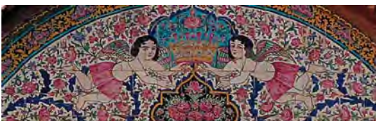
تصویر ۲۸. کاشی‌کاری هفت رنگ سردر نارنجستان قوام، تصویر دو فرشته بالدار با تاجی مزین به مروارید

بر اساس پژوهش‌های انجام شده در شش بنای شاخص دوره قاجار در شیراز، تزیینات کاشی سردرها قابل تفکیک در چهار حوزه موضوعی اساطیری، سیاسی، مذهبی و نمادین است. که با توجه به ماهیت کاشی‌کاری سردر بنا، این نقش‌ها بازگو کننده ویژگی‌های هنر قاجاری و نشان از هویت و فرهنگ قاجار است. در مجالس اساطیری و سیاسی این دوره، داستان فتح یک قسمت، یک جنگ خاص و همچنین تصاویر رزم‌های اساطیری و قهرمانان متداول تر بوده است. در این دوره شاهان قاجار نیز، پیکره نگاری را ابزاری مناسب برای ارتقای مقام سلطنتی