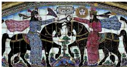
تصویر ۲۴. کاشی‌کاری سردر عمارت باغ عفیف آباد با نقش تاج شاهی و پرچم (مراسم تاج گذاری)

یکی از نقوشی که در سردر خانه زینت الملوک، نارنجستان قوام و بقعه سید تاج الدین غریب وجود دارد، تصویر