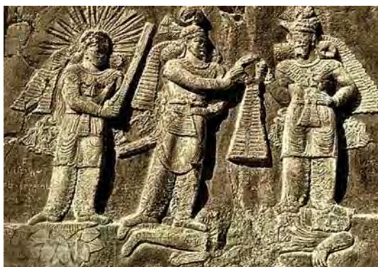
تصویر ۲۱. سنگ نگاره طاق بستان، مراسم تاج گذاری اردشیر دوم، دوره ساسانی

مهمی در زندگی و هنر انسان‌ها داشته است. از نقوش تکرنگ انسان‌های اولیه گرفته تا نقوش حک شده بر صخره‌های ساسانی و نقاشی‌ها و نقش برجسته‌ها دوره اسلامی، صحنه شکار و شکارگاه وجود دارد، خواه بر روی کاشی‌های هفت رنگ، گچ، سقف‌ها و یا روی زمینه چوب و غیره. (نه اورا، ۱۳۸۳: ۱۵۸) برای مثال بشقاب شکار کوچ از آثار دوران ساسانیان، ۴۵۷ تا ۴۸۳ م، که در موزه متروپولیتن، نیویورک، بنیاد فلچر ۲ نگهداری می‌شود. این بشقاب ساخته شده از نقره، حکاکی، برجسته کاری و مرقع کاری شده با قطر ۲۱/۹ س م و ارتفاع ۴/۶ س م، شاه پیروز اول را در حال شکار آهو (قوچ) نشان می‌دهد. (دیویس و دیگران، ۱۳۸۸: ۴۴؛ تصویر ۲۵) همانطور که در سردر خانه زینت الملوک مشاهده می‌شود، صحنه‌هایی از شکار بر روی کاشی هفت رنگ به تصویر کشیده شده است. (تصویر ۲۶) شکارچیان اغلب با سلاح‌های گرم (تفنگ) و با لباس‌های محلی (فارس) در حالت‌ها و فیگورهای متنوع مشغول به شکار آهو و حیوانات دیگر هستند. (شکوهمان و شیرازی، ۱۳۸۹: ۳۷)