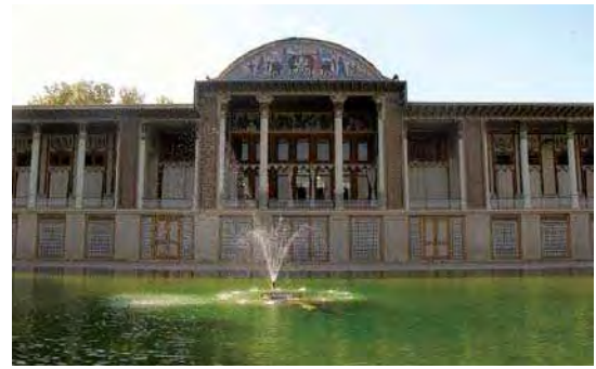
تصویر ۴. نمای روبرو از ضلع شرقی باغ عفیف آباد، تاجگذاری یکی از پادشاهان ساسانی، مأخذ: همان