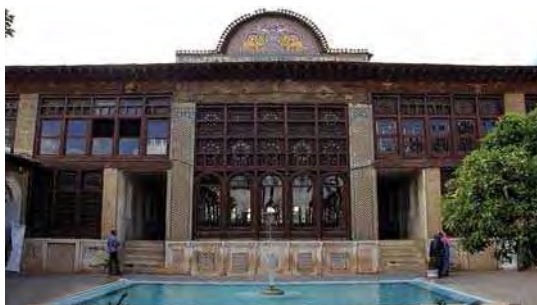
تصویر ۷. نمای روبرو از ضلع شرقی خانه زینت الملوک، شیراز

رو به شمال قرار گرفته و شامل کاشی‌کاری بر دیواری مرتفع است که نقوش متنوعی را در بر گرفته است. در قسمت‌های دیگر ورودی نیز کاشی هفت رنگ استفاده شده و بر روی آنها تصاویر فرشتگان، گل و مرغ و نقوش منظره و تصاویری از وقایع کربلا در قاب‌های دایره‌ای، مستطیل و بیضی شکل در طرح‌های زیبا نقش بسته است. بر روی برخی از آنها نیز آیات قرآنی و احادیث به خط ثلث نگاشته شده و در پایان نیز تاریخ ۱۳۱۰ ه.ق قید شده است. این بقعه در سال ۱۳۸۰ با شماره ۴۵۱۳ در فهرست آثار ملی به ثبت رسیده است. (کمالی سروستانی، ۱۳۸۴: ۹۸-۹۷؛ تصویر ۱۰)