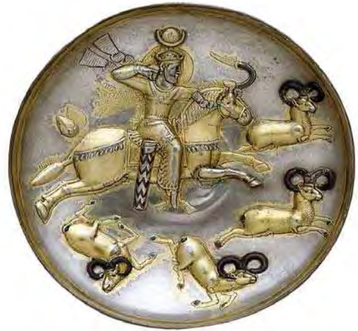
تصویر ۲۵. بشقاب نقره دوره ساسانی، شاه پیروز اول در حال شکار قوچ، مأخذ: دیویس و دیگران، ۱۳۸۸: ۴۴

تصویر نگاری پادشاهان و شاهزادگان از سنت‌های ایران باستان است. در سردر باغ ارم و عقیق آباد نقاشی‌هایی با موضوع پادشاهان ایران در دوره قبل و بعد از اسلام قابل مشاهده است. در نقاشی باغ ارم بر روی کاشی هفت رنگ، به شیوه اروپایی و متأثر از هنرمندان آن سعی در واقع نمایی دارد و ناصرالدین شاه را با لباس آبی رنگ و زیورآلات خاص شاهی، سوار بر اسب سفید در زمینه ای با منظره طبیعی به تصویر کشیده است. (تصویر ۳۱) در کاشی نگاره باغ عقیق آباد نیز تصویر پادشاهان ایرانی (هخامنشی و ساسانی) در مراسم تاج گذاری قابل مشاهده است. (تصویر ۳۲) در نتیجه ترسیم تصویر شاهان در دوره قاجار به صورت ایستاده یا سوار بر اسب، نشسته همراه با عصا و شمشیر در تزیین بناها به یکی از متداول‌ترین رسوم در کاشی کاری مبدل شده بود. پادشاهان قاجار به خصوص فتحعلی شاه و ناصرالدین شاه که دوره زمامداری شان طولانی بوده، در پی شکوه