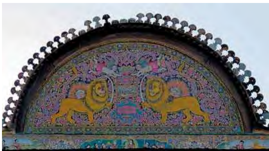
تصویر ۸. کاشی نگاره سردر زینت الملک با نقش شیر و خورشید و ۳ مجلس با موضوع شکار شکارچیان و داستان نارنج و ترنج حضرت یوسف و زلیخا