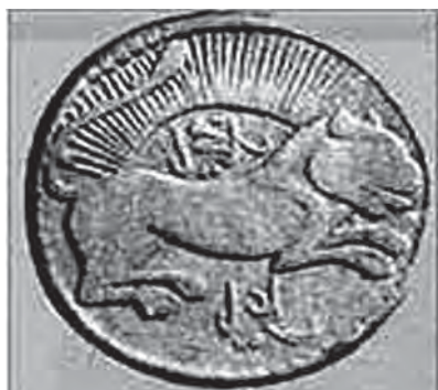
تصویر ۱۷. نقش شیر همراه با خورشید بر روی یک سکه طلای بیست تومانی متعلق به دوره قاجار، مأخذ: خزایی، ۱۳۸۱: ۵۷