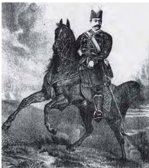
تصویر ۳۳. ناصرالدین شاه قاجار، تصویر چاپ سنگی شماره دوازدهم، روزنامه شرف.

حاکم بر جامعه خویش اند، از این رو نه تنها از نظر زیبا شناختی قابل تحسین اند، بلکه پیام آور تصویری، از پیشینه کهن ایران زمین‌اند. به طور کلی کاشی‌کاری سردربناهای شیراز در دوره قاجاریه، با عناصر و جزئیات فراوان، متنوع به لحاظ رنگ و نقش و بسیار ارزشمند، پدیده ای می‌باشند که توجه