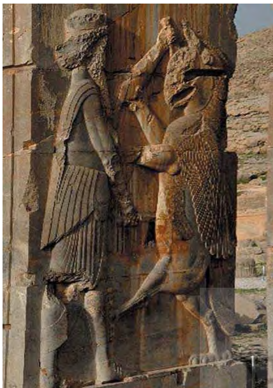
تصویر ۱۵. نقش برجسته هخامنشی، تخت جمشید، نبرد انسان با حیوان اساطیری (نبرد خیر و شر)