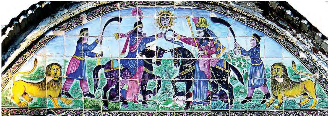
تصویر ۱۸. کاشی‌کاری سردر ورودی باغ عفیف آباد با نقش شیر و خورشید، مأخذ: نگارندگان، ۱۳۹۵