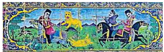
تصویر ۲۶. کاشی‌کاری هفت رنگ سردر خانه زینت الملک، صحنه شکار شکارچیان در شکارگاه با پس زمینه مناظر طبیعی