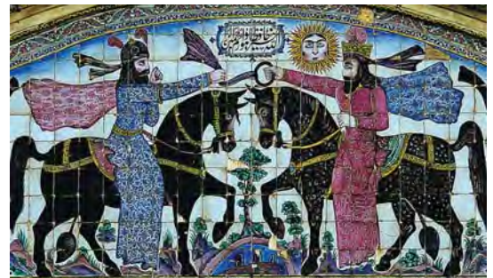
تصویر ۳۲. کاشی‌کاری هفت رنگ سردر ورودی و عمارت باغ عقیف آباد، تصاویر پادشاهان ایران باستان