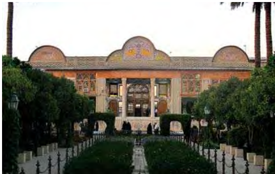
تصویر ۵. نمایی روبرو از عمارت نارنجستان قوام