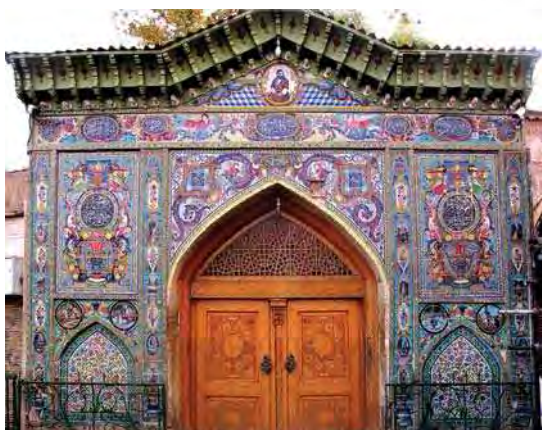
تصویر ۱۰. ورودی بقعه سید تاج الدین غریب

از بقاع متبرکه شیراز است که پیش از دوره قاجاریه در نزدیک دروازه کازرون احداث شده است. این بقعه، آرامگاه جعفر بن فضل بن جعفر بن علی ابن ابی طالب (ع) ملقب به «تاج الدین» و «غریب» است. ورودی این بقعه،