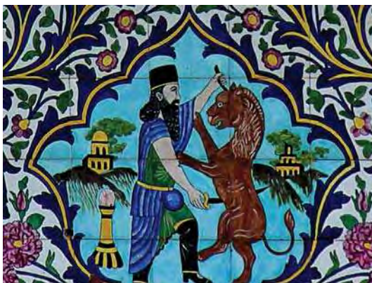
تصویر ۱۴. کاشی‌کاری هفت رنگ سردر عمارت باغ ارم، تصویر پادشاه هخامنشی در حال نبرد با حیوان اساطیری (نبرد خیر و شر)

نقاش به اساطیر را به خوبی نشان می‌دهد. همان گونه که در تصویر ۱۵، نقش برجسته ای از دوران هخامنشیان در تخت جمشید، نبرد انسان با حیوان ترکیبی با سر، بال، پای عقاب و تنه شیر و دم عقرب (نبرد خیر و شر)، قابل مشاهده است.