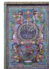
تصویر ۳۰. کاشی‌کاری هفت رنگ ورودی بقعه سید تاج الدین غریب، تصاویر فرشتگان بالدار با لباس‌های پوشیده در حال حمل و نگهداری گل و گلدان‌ها، مأخذ: همان