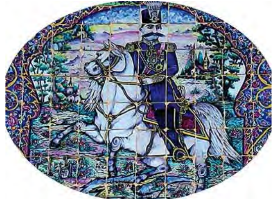
تصویر ۳۱. کاشی‌کاری هفت رنگ سردر عمارت باغ ارم، تصویر ناصرالدین شاه قاجار سوار بر اسب

بر این اساس در مقاله حاضر، نقوش سردر بناهای