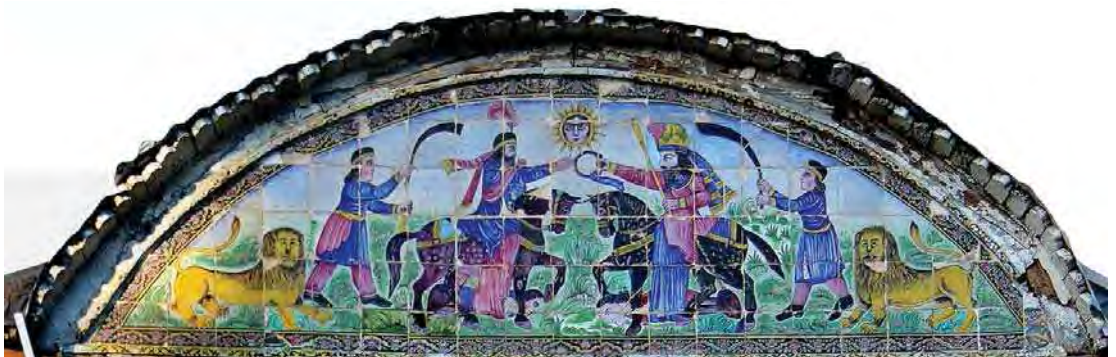
تصویر ۳. سردر عمارت باغ عفیف آباد، مجلس تاج گذاری پادشاه ساسانی

شیراز به دلیل سابقه تاریخی در تأثیر پذیری فرهنگ غربی، نقش اول را ایفا می‌کند. اما اغلب کاشی‌کاری‌های شیراز به خصوص بناهای نام برده، را کاشی‌های تصویری با مضامین ججاری‌های تخت جمشید و نقوش برجسته ساسانی تشکیل می‌دهد. تا پایان دوره قاجار در مکتب نگارگری شیراز مضامین کتاب‌های ادبی کلاسیک ایران همچون هزار و یک شب، شاهنامه، پنج گنج نظامی، دیوان حافظ و آثار سعدی، همچنین قصص قرآنی چون داستان یوسف و زلیخا، ملک سلیمان و ... همواره مد نظر هنرمندان نگارگر شیراز بوده و در کاشی‌کاری بناهای شیراز به وفور از این نگاره‌ها و داستان‌ها استفاده شده است. استفاده از کاشی در نماهای بیرونی به صورت گسترده رواج داشت. توجه به رنگ‌های شاد به ویژه طیف قرمز و تأکید بر عنصر انسانی در نگاره‌ها از ویژگی‌های مکتب شیراز است. (ریاضی، ۱۳۹۵: ۵۱) کاشی‌های شیراز از نظر کیفیت و طراحی خام دست ترند، اما سرزندگی،