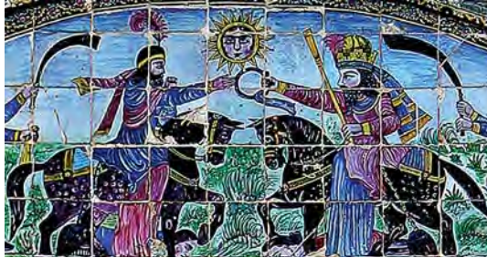
تصویر ۲۳. کاشی‌کاری سردر ورودی باغ عفیف آباد با نقش تاج شاهی و پرچم در دست پادشاهان ایران، مأخذ: همان

شکار و شکارگاه از دیرباز مورد توجه انسان‌ها بوده است، گاه به دلیل رفع نیازهای اولیه و گاه تفریح و تفرج و گاه به عنوان نشان قدرت و توانایی. این موضوع نقش