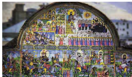
تصویر ۹. سردر حسینیه مشیر با موضوع قیامت و کربلا