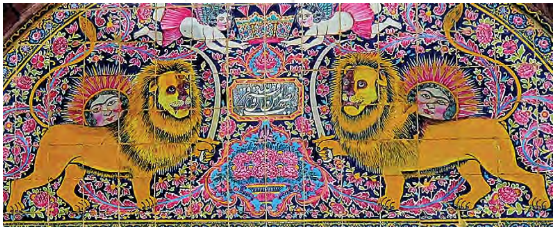
تصویر ۲۰. کاشی‌کاری سردر عمارت زینت الملک با نقش شیر و خورشید، مأخذ: همان

در سردرهای باغ عفیف آباد، نارنجستان قوام و خانه زینت الملوک، نقش شیر شمشیر به دست همراه با خورشید و تاج شاهی به صورت قرینه ترسیم شده است. (به ترتیب تصویر ۱۸ و ۱۹ و ۲۰) خورشید دارای چشم و ابرو، به شکل زن، و شیر در حالی که بدن آن نیم رخ و سر تمام رخ، سه رخ و نیم رخ است با شمشیری در دست تصویر شده است. مانند سایر نقاشی‌ها، نیمی از خورشید پشت شیر قرار گرفته و شعاع‌های نور به صورت خطوط