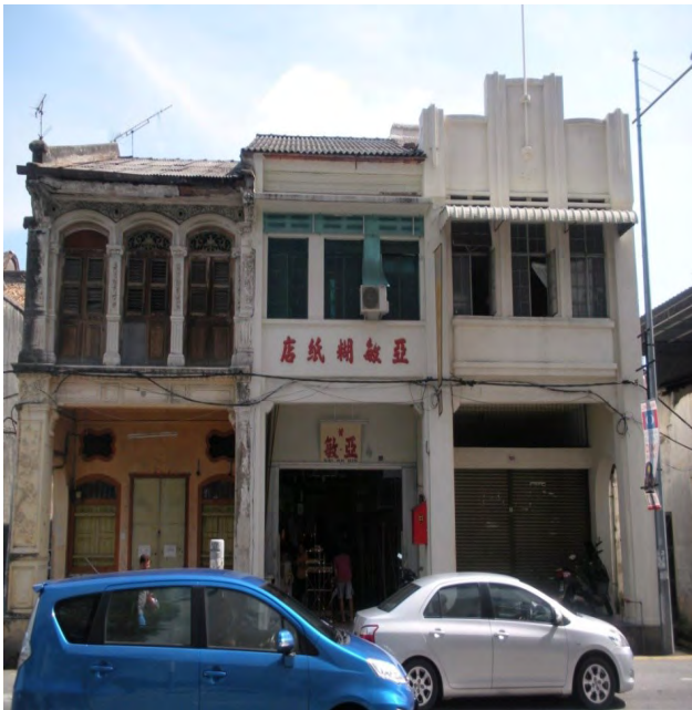
تصویر ۵: سبک آرت دکو. عکس: آصف علی، ۱۳۹۷.