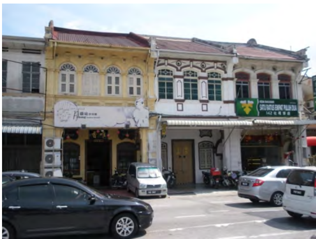
تصویر ۳: سبک کاملاً اروپایی با طاق‌های نیم دایره. عکس: آصف علی، ۱۳۹۷.