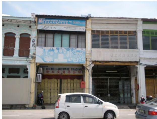
تصویر ۲: سبک خانه-مغازه‌های دائمی اولیه حتی پس از اصلاح نیز محسوس است.

و مواد و مصالح موجود در آن منطقه برای ساخت‌وساز بوده است. این پدیده را می‌توان در مورد سیر تکاملی خانه-مغازه‌ها در مالزی مشاهده کرد. خانه-مغازه‌های اولیه کاملاً بومی بودند و مصالح اولیه آنها الوار بود که در خانه‌های بومی اتپ نیز از آن استفاده می‌شد. اگرچه کاملاً غیرممکن است که بتوان خانه-مغازه‌های سبک اتپ را در مطالعه حاضر پیدا کرد؛ اما شواهدی از حضور این سبک در گذشته وجود دارد. با نفوذ و ادغام اصول طراحی خارجی و نیاز به یک ساختار دائمی که بتواند ساختمان‌ها را از حوادث احتمالی در منطقه محافظت کند، سبک خانه-مغازه‌ها بسیار تغییر کرده است. در نتیجه، ساختارهای سنگی تکامل یافتند و روند ترکیب مشخصه‌های مختلف در خانه-مغازه‌ها با اصول طراحی مختلف بیشتر از گذشته ادامه یافت و مشخصه‌های جدید خارجی را نیز قرض گرفت. مرز باریک میان سبک‌های مختلف خانه-مغازه‌ها باعث عدم توافق میان محققان در شناخت سبک‌های متمایز شد. یافته‌های این مطالعه نشان می‌دهد که تنها دو سبک می‌تواند تحت عنوان کاملاً برجسته در نظر گرفته شود یعنی سبک اتپ و سبک آرت دکو (تصویر ۵). اکثر محققان آنها را در منتهی‌الیه یک خط، یعنی اواخر قرن نوزدهم و اواسط بیستم قرار دادند (Widodo, 2011). این تحقیق با توجه به رویکرد اکلکتیک (تلفیقی) آنها، به محققان پیشنهاد می‌کند که در طبقه‌بندی‌شان تمایز ایجاد کنند. یافته‌های این تحقیق نشان می‌دهد این طبقه‌بندی براساس سبک که به‌وسیله حسن و یحیی انجام گرفته، برای جورج تاون پنانگ مناسب است. اگرچه، به‌نظر می‌رسد دوره گذار گسترده‌تر از آن است که بتواند به دوره اولیه و نهایی تقسیم شود و سبک آرت دکو نیز می‌تواند به‌صورت دوره‌ای به سبک کاملاً اروپایی اضافه شود (جدول ۵).