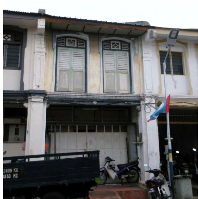
تصویر ۴: خانه-مغازه‌هایی با دو طاق کمانی در طبقه اول.

جدول ۴: تعداد مشخصه‌های هر گروه.