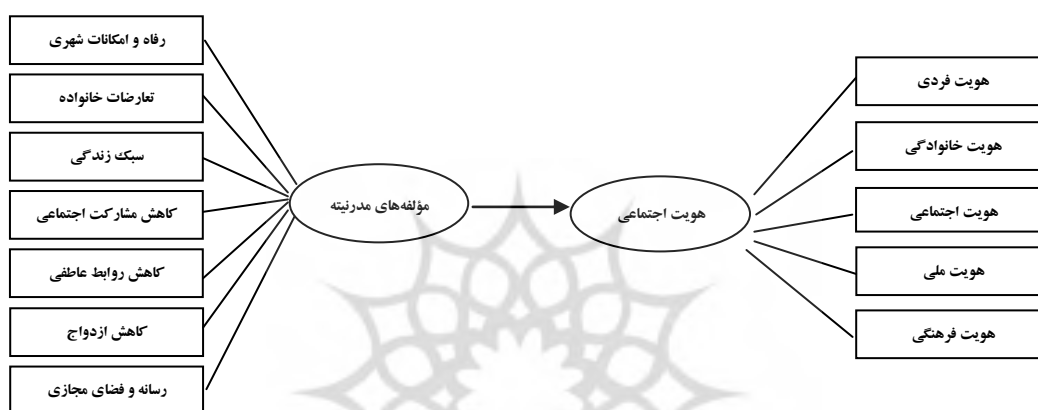
شکل (۱) مدل مفهومی پژوهش

طبق مباحث مطرح شده در مبانی نظری تحقیق مدل مفهومی پژوهش به شکل زیر طرح می‌گردد.