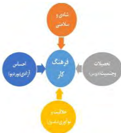
نمودار (۱): عوامل مؤثر بر فرهنگ کار از دیدگاه صاحب‌نظران

با توجه به مدل نظری عوامل مؤثر بر فرهنگ کار در این پژوهش در جستجوی آزمون فرضیه‌های زیر هستیم: