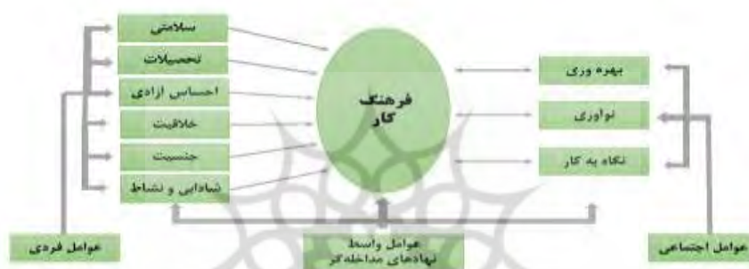
نمودار (۵): نقش و تأثیر کلیدی نهادهای واسطه (دمکراتیک) در پیشرفت فرهنگ کار

در نهایت تأثیر کلیدی ساختارهای نهادی جامعه در ضعف یا قوت فرهنگ کار بسیار حائز اهمیت می‌باشد، که در نمودار شماره ۵ قابل مشاهده می‌باشد. یعنی اگر تحولات نهادی در راستای امر توسعه صورت نگیرد هر تلاشی برای بهبود وضعیت جامعه در نهایت خنثی شده و تحولی بوجود نمی‌آید. آنچه تاکنون در ایران معاصر شاهد آن بوده‌ایم فقدان تحولات نهادی متناسب با سطح مورد نیاز توسعه بوده است.