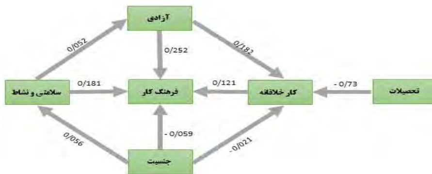
نمودار (۴): تأثیر مستقیم و غیر مستقیم متغیرهای مستقل بر متغیر وابسته