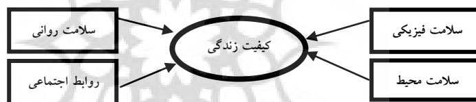
نمودار ۱: عوامل مؤثر بر کیفیت زندگی از دیدگاه سازمان جهانی بهداشت

چابکی، درد و ناراحتی، خواب و استراحت، ظرفیت و توانایی برای کار و فعالیت می‌باشد. ۲- سلامت روانی شامل رضایت و تصور شخص از خود و ظاهر بدنی‌اش، احساسات مثبت و منفی فرد، اعتماد به نفس، اعتقادات روحی، مذهبی، شخصی، تفکر، یادگیری و حافظه و تمرکز می‌باشد. ۳- روابط اجتماعی شامل ارتباطات شخصی، حمایت اجتماعی و فعالیت جنسی می‌باشد. ۴- سلامت محیط شامل منابع مادی و مالی، آزادی، ایمنی، میزان در دسترس بودن و کیفیت مراقبت‌های بهداشتی، درمانی و اجتماعی، فرصت‌های پیش رو برای کسب و به دست آوردن اطلاعات و مهارت‌های جدید، امکان فعالیت‌های تفریحی، سلامت محله‌ای که شخص در آن زندگی می‌کند و امکانات آن و همچنین سلامت محیط خانه می‌باشد (نجات و دیگری، ۱۳۸۵: ۱۱).