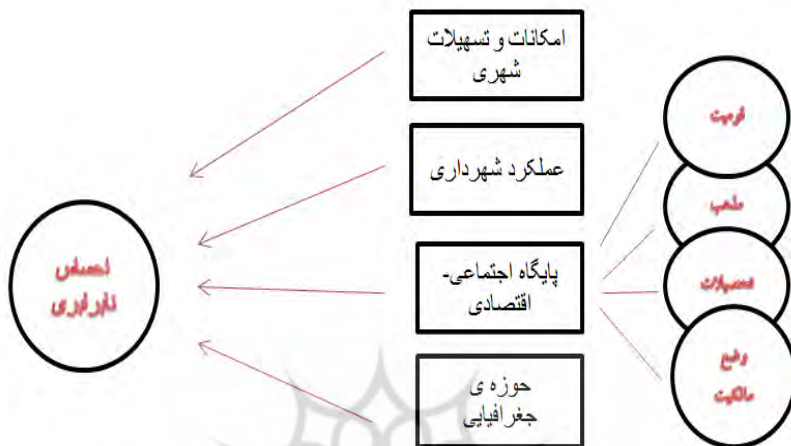
شکل ۱-مدل تحلیلی تحقیق