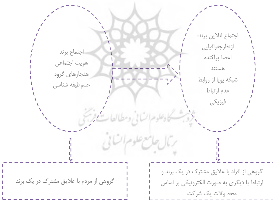
شکل ۱: از اجتماع آنلاین به اجتماع آنلاین (sicilia & palazon, 2008:258)

در حالی که ارتباط شبکه ها برای برندها در محیط آنلاین، نامحدود است، اما رسانه اجتماعی، دسترسی و وضوح شبکه های اجتماعی مشتریان را افزایش می دهد و تجهیز