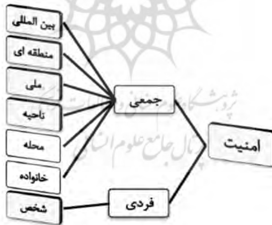
شکل 2- سطوح امنیت (حسینی و ناروقه، 1394)

ایجاد امنیت در شهر و همچنین فراهم نمودن بسترهای مورد نیاز جهت برقراری نظم و امنیت در محیط شهر وابسته به ایجاد قانون، اجرا و نظارت بر اجرای آن است. همچنین برای دستیابی به امنیت اجتماعی جدی گرفتن مشارکت شهروندان در همه