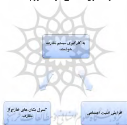
شکل 4- مدل مفهومی پژوهش