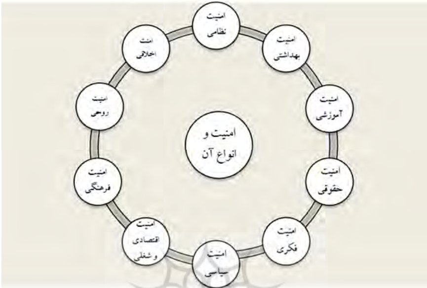
شکل 1- انواع امنیت