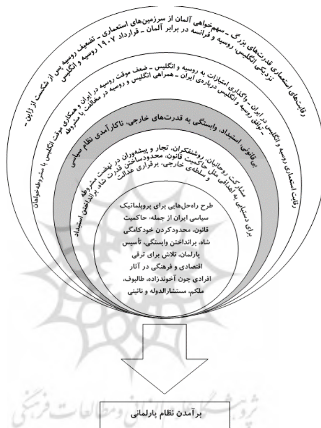
شکل ۳. سطوح تحلیل مدرنیته‌ی سیاسی در ایران (۱۸۹۰-۱۹۰۸)