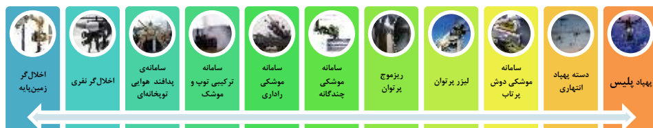
شکل (۱) نمودار سبب محصولات ضد پهپاد

جهت تعیین وزن دهی به معیارها، فرآیند استفاده از ماتریس مقایسه زوجی انتخاب شد. در ضمن گزینه‌های مناسب جهت تعیین سبب محصولات ضد پهپاد برای ارائه به خبرگان در پرسش‌نامه نیز تدوین شدند (شکل ۱). در جدول (۴) نقاط قوت و ضعف گزینه‌های پیشنهادی که به خبرگان داده شده، آمده است.