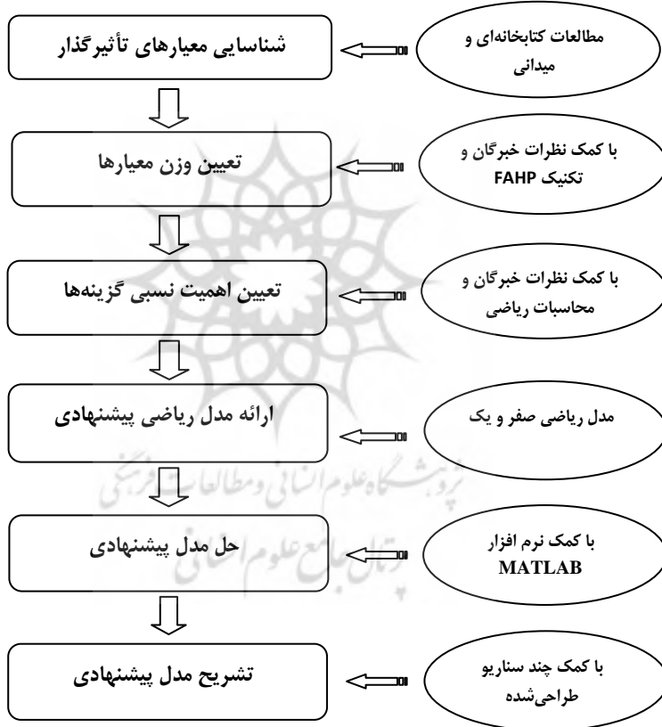
شکل شماره ۱: فرآیند انجام تحقیق

با توجه به اهداف ذکر شده، فرآیند انجام تحقیق برابر شکل شماره یک ارائه گردیده است.