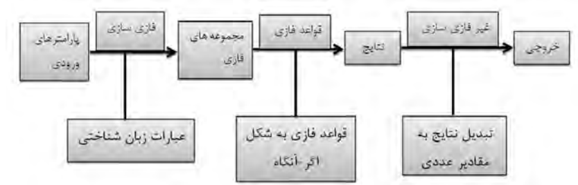
شکل (۱) - شکل کلی سیستم استنتاج فازی

سیستم‌های فازی، یک چارچوب محاسباتی پرتعداد بر مبنای مفهوم مجموعه‌های فازی، قواعد «اگر - آنگاه» و استدلال فازی هستند. شکل کلی سیستم استنتاج فازی در شکل ۱ نشان داده شده است.