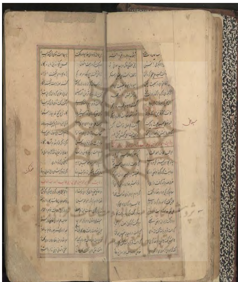
تصویر ۱: «ولایت‌نامه» در جنگ ۳۵۲۸ دانشگاه تهران

بخش مقدمه، تنه اصلی قصیده و شریطه زبان شعر ساده و نرم است. ذکر داستان یکی از عناصر اصلی این نوع ادبی است که در تنه اصلی قصیده جای دارد و شاخصه اصلی این داستان آن است که در ذکر کرامات و معجزات حضرت علی (ع) است. این گونه ادبی به فرهنگ شیعیان اختصاص دارد و بیشتر در شأن حضرت علی (ع) سروده شده است.