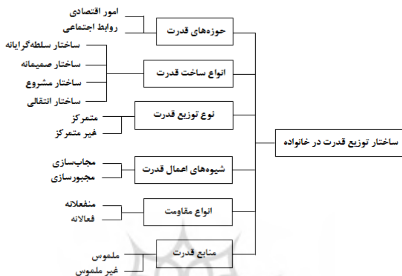
نمودار ۱: ساختار توزیع قدرت در خانواده