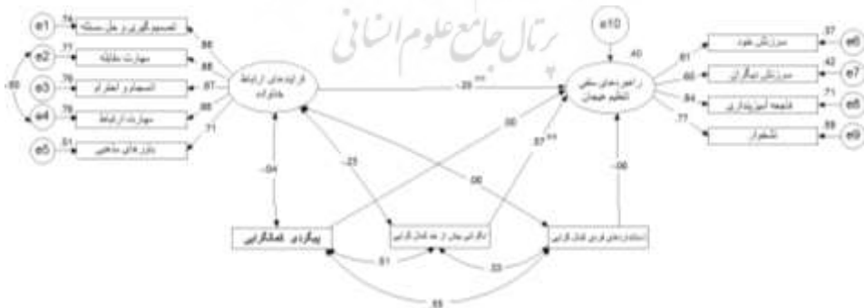
شکل ۲. الگوهای ساختاری پژوهش در تبیین رابطه ابعاد کمال‌گرایی و فرایند ارتباطی خانواده بر راهبردهای منفی تنظیم هیجان

در شکل ۱، مجذور همبستگی‌های چندگانه برای راهبردهای مثبت تنظیم هیجان برابر با ۰/۳۱ است، که نشان می‌دهد ۳۱ درصد از واریانس راهبردهای مثبت تنظیم هیجان تغییرها در نمره‌های فرایند ارتباط خانواده و ابعاد کمال‌گرایی تبیین می‌کند.