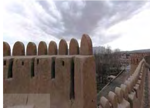
تصویر ۸. حصار ارگ رایین ( http://www.hamshahrionline.ir ) تصویر ۹. حصار ارگ بم (نگارندگان).