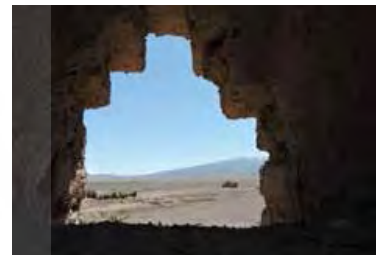
تصویر ۱۳. تیرکش‌ها و روزنه‌های ارگ بم (نگارندگان).