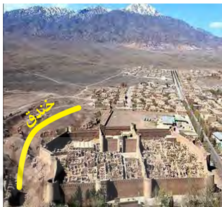
تصویر ۱۵. خندق در عکس هوایی ارگ بم.