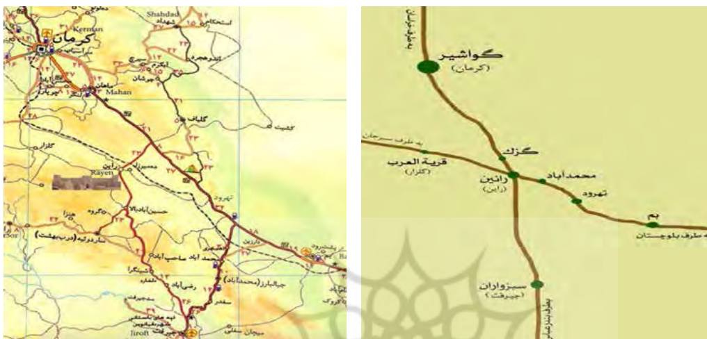
تصویر ۵. مسیر دسترسی و راه‌های ارتباطی رایین و بم ( http://www.rayen.ir ).

اثری نیست، اما برخی دیگر هنوز به حیات خود ادامه داده‌اند. این راه از رایین می‌گذشت و از راه دازین و بم و نماشیر به فهرج در حاشیه کویر و سپس سیستان می‌رفت (غلامی دهقی، ۱۳۸۲: ۲۸۴)، (تصویر ۵). بنابراین، اهمیت تجاری، سیاسی و نظامی این راه، از یک سو سبب گسترش این دو ارگ و از سوی دیگر باعث شکل‌گیری استحکامات دفاعی و نظامی و بازسازی پی‌درپی آن‌ها در دوران اسلامی شده بود (برسم، ۱۳۹۴: ۸۴).