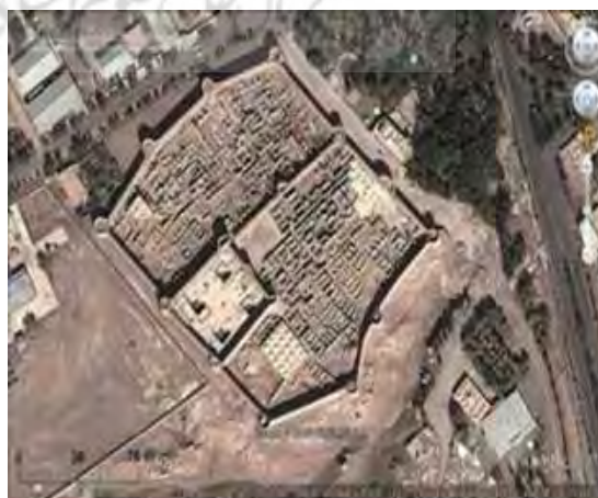
تصویر ۳. عکس هوایی ارگ راین.