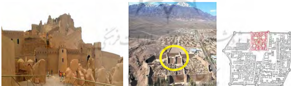
تصویر ۲۱. ارگ حاکم‌نشین بزم (نگارندگان).