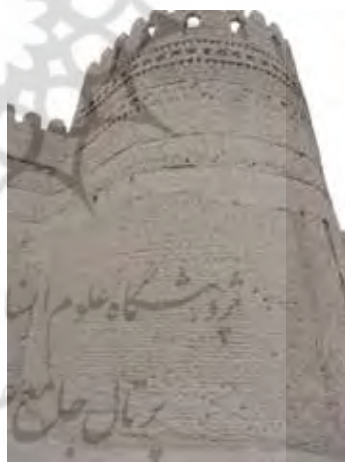
تصویر ۱۱. برج‌ها ارگ بم (www.tishineh.com).