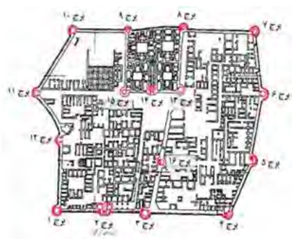
نقشه ۲. شماره گذاری برج‌ها در ارگ رایین (طرح از: نگارندگان).

و فضاهای موجود، با توجه به موقعیت استقرار در مجموعه، متفاوت است. تقریباً، اکثر برج‌های جبهه جنوبی به غیر از ورودی، چهارضلعی و دارای فضاهای ویژه‌ای برای استقرار بوده و سایر برج‌ها به فرم مدور و تعداد محدودی چهاروجهی هستند. در جبهه غربی، یکی از برج‌ها از پیچیدگی فضایی و ساختاری خاصی برخوردار بوده است. به نظر می‌رسد ساختار اولیه آن‌ها چندضلعی بوده و سپس در دوره‌های بعد به فرم مدور تغییر شکل یافته‌اند (فرح بخش و صفامنصوری، ۱۳۹۵: ۲۲۰)، (تصویر ۱۱). برجک‌های دیده‌بانی ارگ، به فواصل مساوی قرار نگرفته‌اند و اصولاً جاهایی آن‌ها وابسته به فراز و نشیب سطح تپه و شکستگی‌های حصار بوده است (پازوکی، ۱۳۷۶: ۹۶).