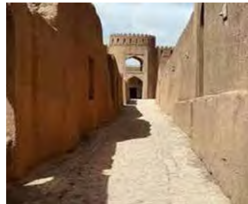
تصویر ۱۸. کوچه اصلی ارگ راین (نگارندگان). تصویر ۱۹. کوچه اصلی ارگ بم (نگارندگان).