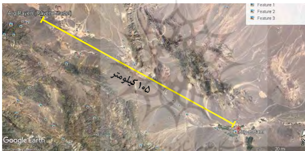
تصویر ۱. تصویر ماهواره‌ای فاصله‌ی ارگ راین و بام.