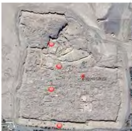
تصویر ۴. عکس هوایی ارگ بام.