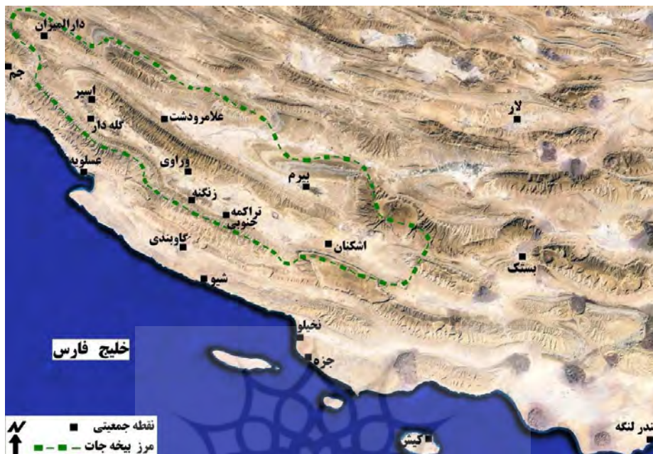
نقشه ۲- محدوده بیخه جات. تصویر ماهواره‌ای مبنا: بخشی از لندفرم‌های زاگرس جنوبی، دریافت از Google Earth (2010).