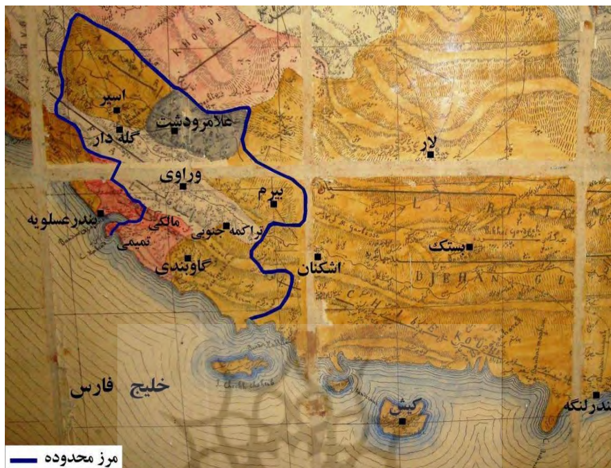
نقشه ۱- مناطق مورد مطالعه در دوره قاجار. نقشه مبنا از: حسینی فسائی، ۱۳۱۳ ه.ق. [۱۲۷۵ خ].