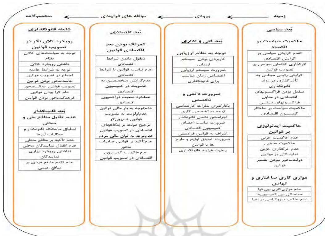
شکل ۵. مدل ارزیابی خطمشی‌های اقتصادی مصوب مجلس شورای اسلامی