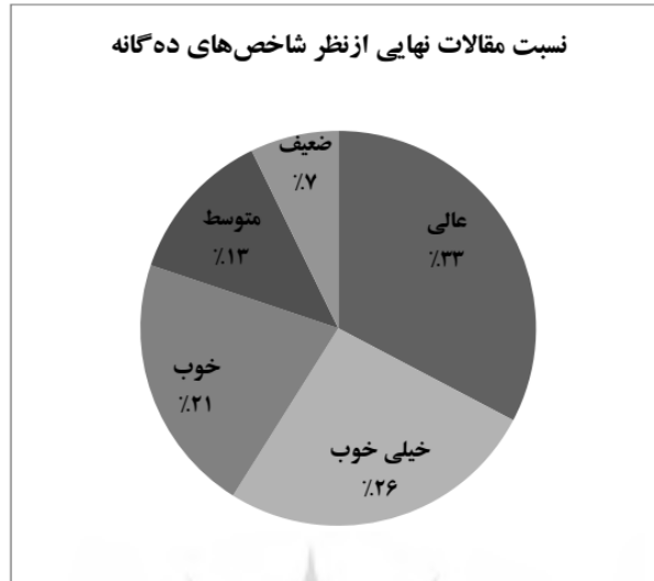
نمودار ۲. نسبت مقالات نهایی از نظر شاخص‌های ده‌گانه