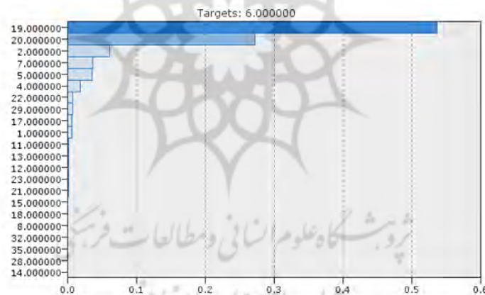
شکل ۲. متغیرهای تاثیرگذار بر سودآوری

پس از شناسایی متغیرهای تاثیرگذار بر سودآوری شرکت‌ها به عنوان ورودی درخت تصمیم C5 به پیش‌بینی سودآوری آنها در سال ۹۶ در هر خوشه پرداخته شد. اما از آنجایی که یکی از محدودیت‌های درخت تصمیم در نرم‌افزار Clementine این است که نمی‌تواند مستقیماً از داده‌های استخراج شده از پایگاه داده بورس اوراق بهادار تهران استفاده کند، بنابراین نیاز به تبدیل این داده‌ها وجود دارد که براساس طیف لیکرت داده‌ها