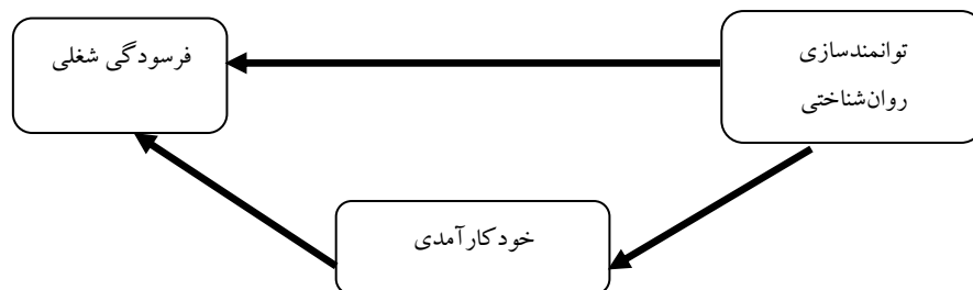
شکل ۱: مدل مفهومی تحقیق