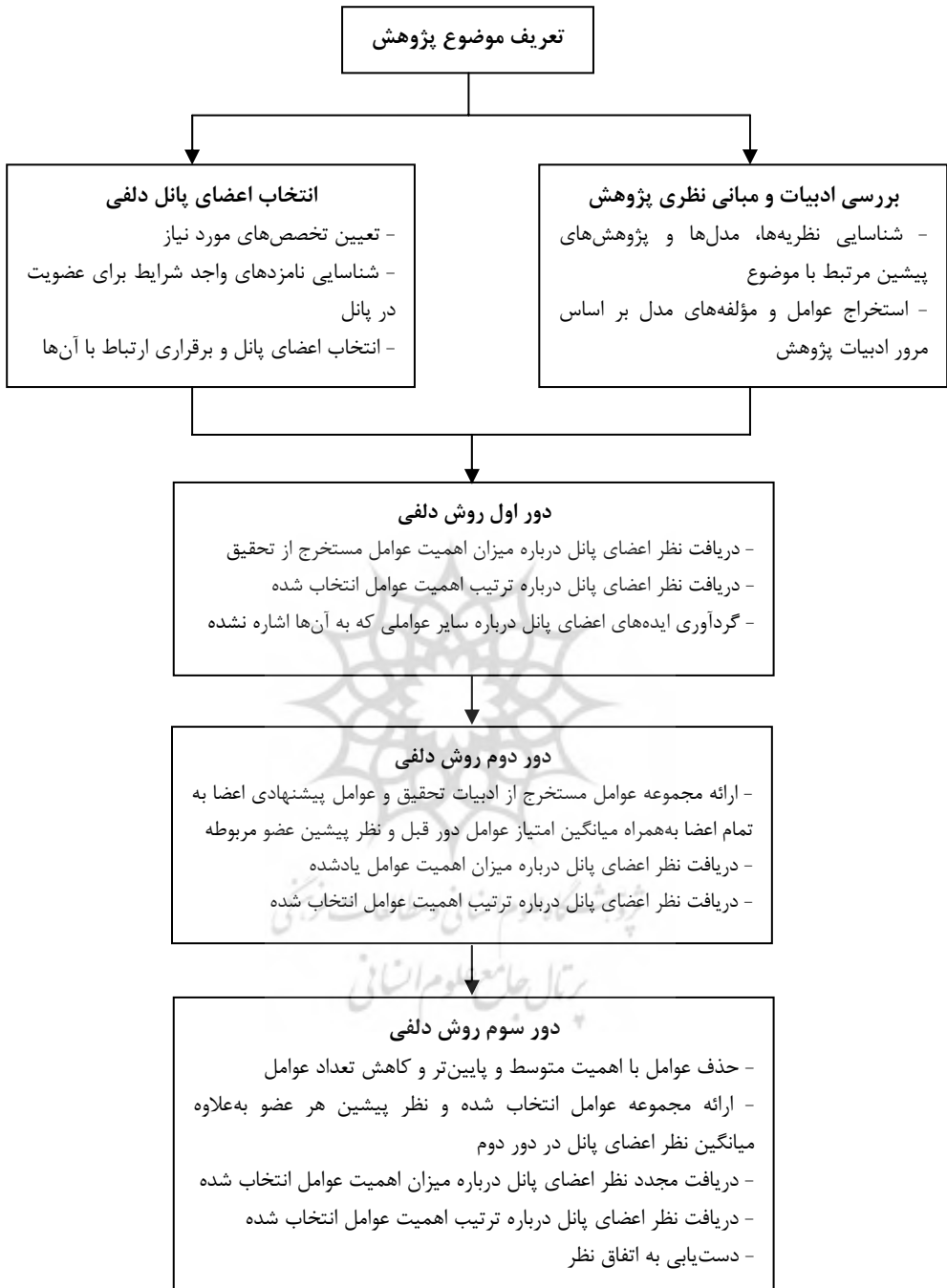
شکل ۲. فرآیند اجرای روش دلفی