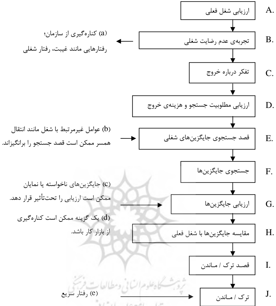
شکل ۱. فرآیند تصمیم‌گیری جابه‌جایی کارکنان