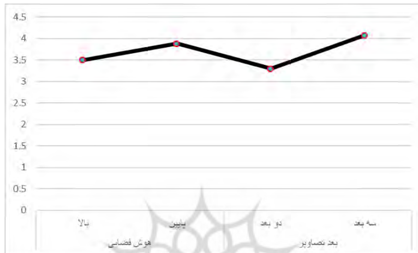
شکل ۲. مقایسه میانگین‌های حاشیه‌ای فعالیت مغزی در سطوح هوش فضایی و بعد تصاویر

دانش آموزان در زمان ارائه تصاویر سه‌بعدی بیشتر است. به دلیل هم‌مقیاس بودن داده‌ها می‌توان به مقایسه نمودار میانگین‌ها برای چهار میانگین حاشیه‌ای به صورت هم‌زمان پرداخت.