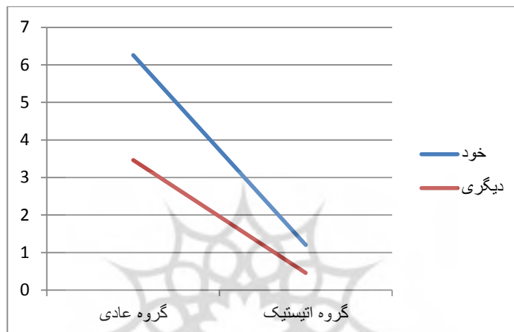
نمودار (۳) اثر تعاملی گروه و محرک بر یادآوری کلمات

یادآوری کلمات مرتبط به خود و دیگری در کودکان اتیستیک به طور معناداری کمتر از همین تفاوت در کودکان عادی است. این تعامل در نمودار (۳) نمایش داده شده است.