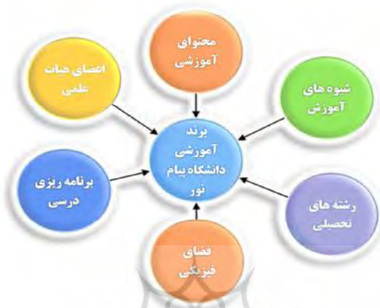
شکل 2. مدل مفهومی ارتقا برند آموزشی دانشگاه پیام نور