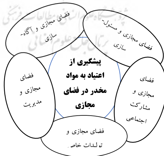
شکل ۱: مدل مفروض پیشگیری از اعتیاد در فضای مجازی

لذا با توجه به ویژگی‌های فضای مجازی و نیاز مبرم به ارائه مدلی جامع در جهت پیشگیری از گرایش به مواد مخدر که از طریق کارکردهای منبث از این فضا حاصل می‌شود، در این پژوهش تلاش شده است تا نسبت به ارائه مدل جامع پیشگیرانه از اعتیاد به مواد مخدر در فضای مجازی اقدام شود. در اصل این تحقیق به جهت آزمون مدل ساختاری برابر با شکل ۱ انجام شده که هدف از آن پاسخ به سوال زیر می‌باشد. ۱- مدل پیشگیری از اعتیاد در فضای مجازی به چه صورت می‌باشد؟