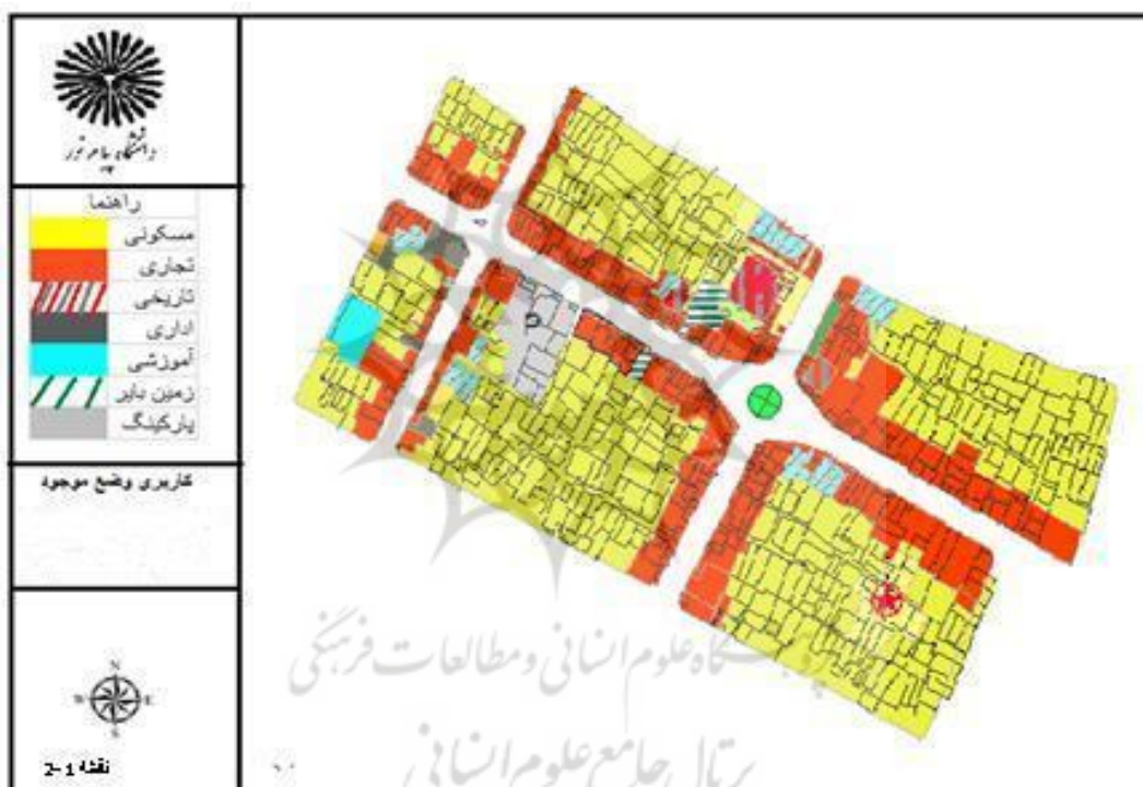
شکل (۱) بررسی کاربری‌های محدوده مورد مطالعه

ابتدا با استفاده از روش اسنادی و ابزاری همچون کتاب‌ها، مقالات، مجلات و ... به گردآوری اطلاعات مربوط به محدوده مورد مطالعه پرداخته و سپس با استفاده از روش غیر اسنادی (میدانی)، بازدید میدانی و تهیه عکس به تجزیه و تحلیل وضع موجود و ارائه راهکارهای مناسب پرداخته شد. سپس شاخص‌های کیفیت محیطی بررسی و تحلیل شده است، تا با تأکید بر ابعاد فرهنگی اجتماعی، به تأثیر پیاده راه بر تعاملات اجتماعی با استفاده از برداشت‌های میدانی و مصاحبه با ساکنان به جمع‌آوری داده‌ها پرداخته شده است.