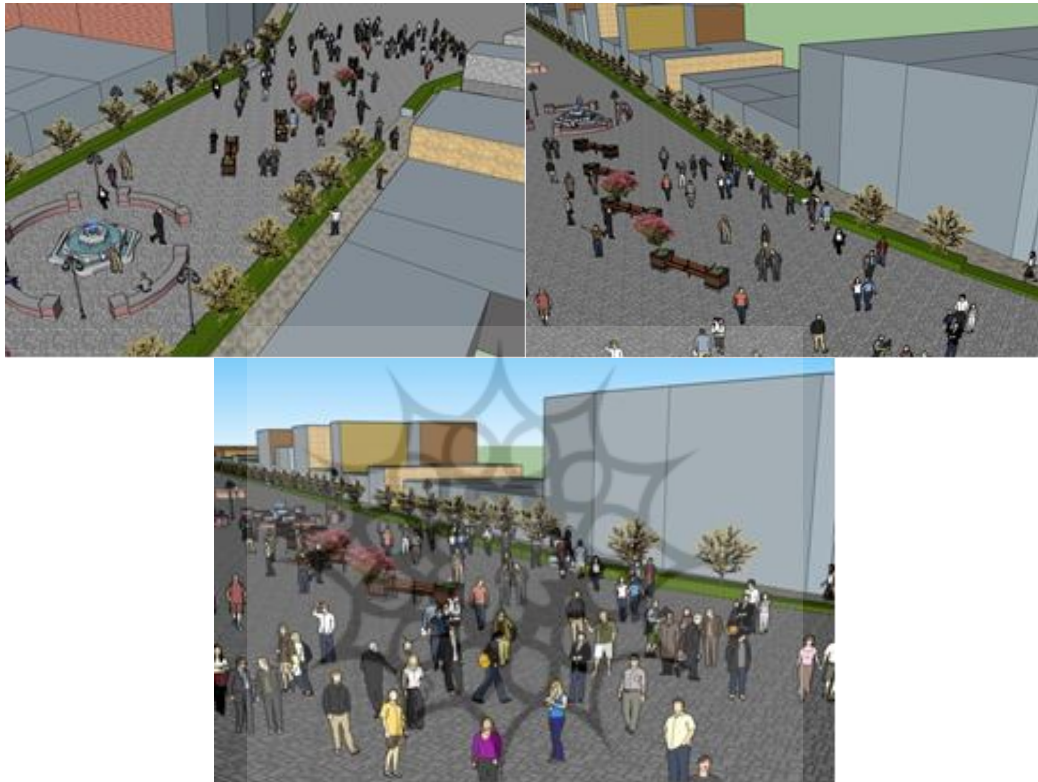
شکل (۷) طرح های پیشنهادی محدوده مورد مطالعه

شهری ونیز تصمیم مردم برای پیاده روی در یک مکان خاص اثر دارد را مشخص می نماید. انتخاب افراد برای پیاده روی و لذت از یک فضای شهری مانند پیاده راه می تواند بر اساس درک ذهنی آنها از فضا، یا ویژگی های محیطی فضای شهری صورت گیرد شکل (۷).