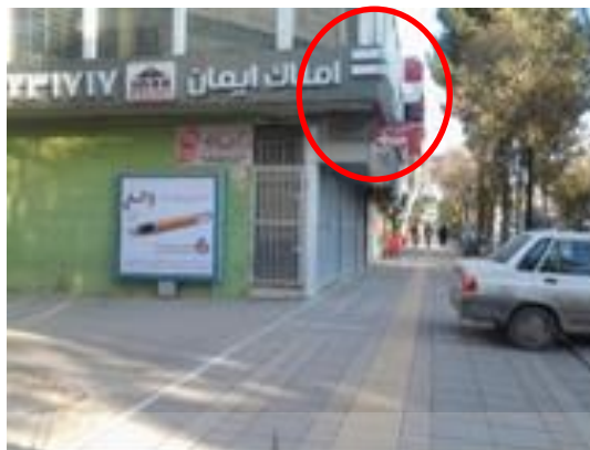
شکل (۴). پیش آمدگی بدنه ساختمان‌ها (نظیر بالکن، تراس و ...) در فضاهای شهری

برداری از این فضاها به عنوان انباری (محل نگهداری مواد غذایی، سوخت و ...) و خشک نمودن البسه ممنوع است. شکل (۳).