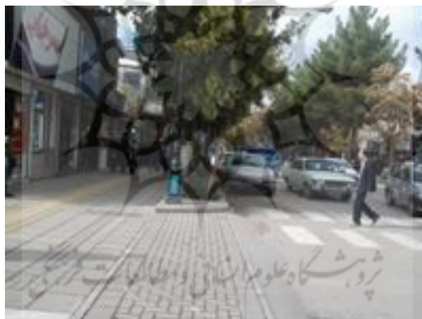
شکل (۶) اختلاف سطح (لبه، پله، سکو و ...) در مسیر عبور در معابر پیاده

ایجاد هرگونه اختلاف سطح (لبه، پله، سکو و ...) در مسیر عبور در معابر پیاده ممنوع است و تغییرات سطوح بایستی بوسیله شیب راهه و رمپ انجام شود. شکل (۶).