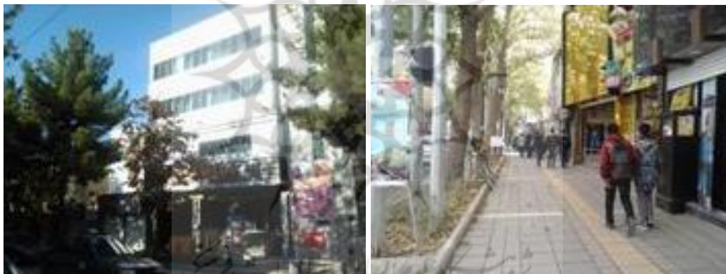
شکل (۳). تقسیم بنا به احجام متناسب با دانه بندی بخش تاریخی شهر

طرح و اجرای بناهای واقع در مناطق تاریخی شهر باید دارای مقیاس انسانی بوده و دانه بندی و ریخت شناسی مشابه بافت تاریخی شهر داشته باشد. در طراحی معماری بناهای کلان مقیاس، تقسیم بنا به احجام متناسب با دانه بندی بخش تاریخی شهر الزامی است.