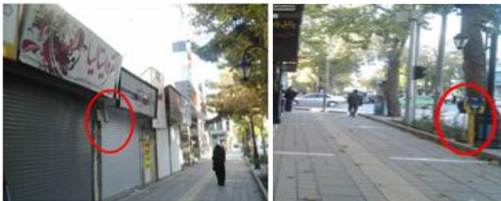
شکل (۵) مکان یابی کابین ها، کیوسکها در معابر پیاده

ایجاد هرگونه اختلاف سطح (لبه، پله، سکو و ...) در مسیر عبور در معابر پیاده ممنوع است و تغییرات سطوح بایستی بوسیله شیب راهه و رمپ انجام شود. شکل (۶).