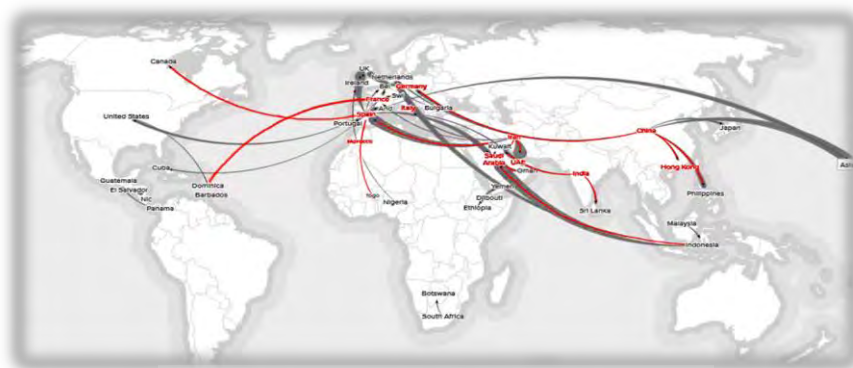
شکل ۱. وضعیت شبکه تجارت خارجی زعفران کشورهای مورد مطالعه

هند، هنگ‌کنگ و مراکش می‌باشد که ۹۰ درصد ارزش کل تجارت جهانی زعفران را به خود اختصاص داده‌اند (پایگاه آماری تجارت بین‌الملل، ۲۰۱۷).