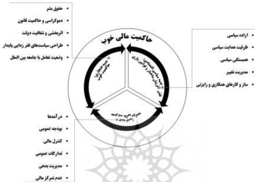
شکل ۱. جنبه‌های حاکمیت مالی خوب (BMZ, 2014)

اقتصادی - سیاسی) و ابزارها و فرایندهای فنی که همان مدیریت مالی عمومی است (جنبه فنی) ارائه شده است.