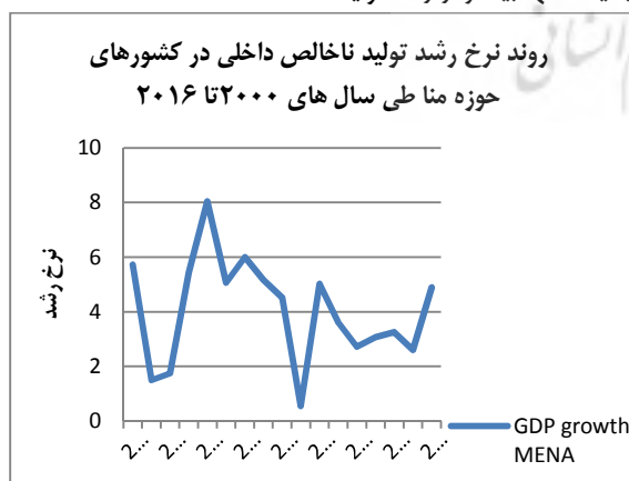
نمودار ۲. بی‌ثباتی در روند نرخ رشد تولید ناخالص داخلی کشورهای حوزه منا

در شکل (۲) بی‌ثباتی نرخ رشد GDP در کشورهای حوزه منا مشاهده می‌شود. علت بی‌ثباتی نوسانات قیمت نفت و بحران مالی به وجود آمده در سال ۲۰۰۸ است. بیشتر کشورهای حوزه منا وابسته به درآمدهای نفتی هستند و با افزایش قیمت نفت در سال ۲۰۰۲ نرخ رشد تولید ناخالص ملی افزایش می‌یابد و از سال ۲۰۰۸ با به وجود آمدن بحران مالی رشد تولید ناخالص ملی کاهش می‌یابد. رشد درآمد سرانه در این کشورها کمتر از رشد تولید ناخالص ملی است زیرا رشد جمعیت آنها بیشتر از رشد تولید است.