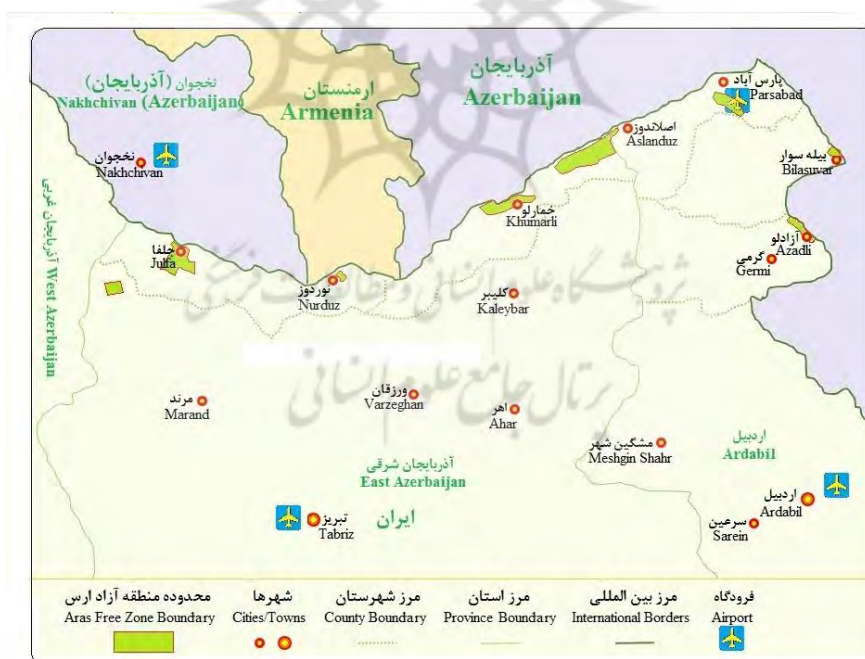
شکل شماره ۱. موقعیت جغرافیایی محدوده مورد مطالعه

منطقه آزاد ارس با مرکزیت جلفا در فاصله ۱۳۷ کیلومتری تبریز و ۷۶۱ کیلومتری تهران در شمال غرب کشور در نقطه صفر مرزی در مجاورت با کشورهای ارمنستان، آذربایجان و جمهوری خودمختار نخجوان و حاشیه رودخانه زیبای ارس به طول ۱۲۸ کیلومتر با چشم‌اندازی زیبا و دیدنی استقرار یافته است.