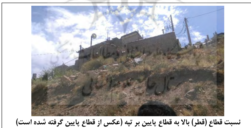
نسبت قطاع (قطر) بالا به قطاع پایین بر تپه (عکس از قطاع پایین گرفته شده است)