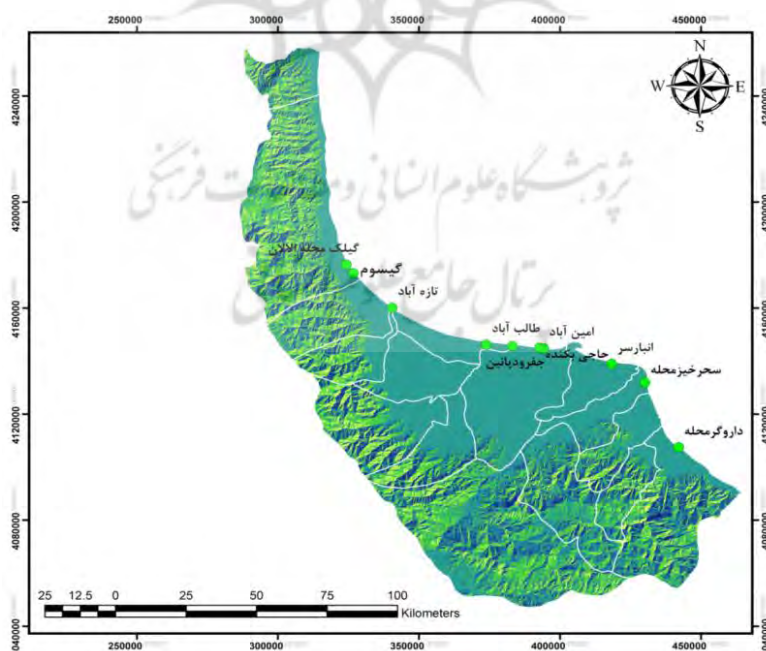
شکل ۲. پراکندگی فضایی مقاصد گردشگری ساحلی روستایی مورد مطالعه