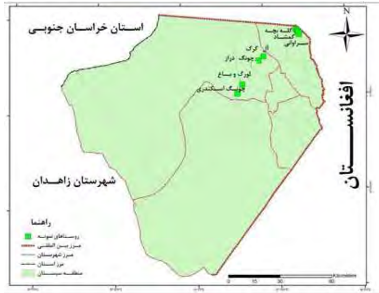
شکل - ۲: معرفی محدوده پژوهش