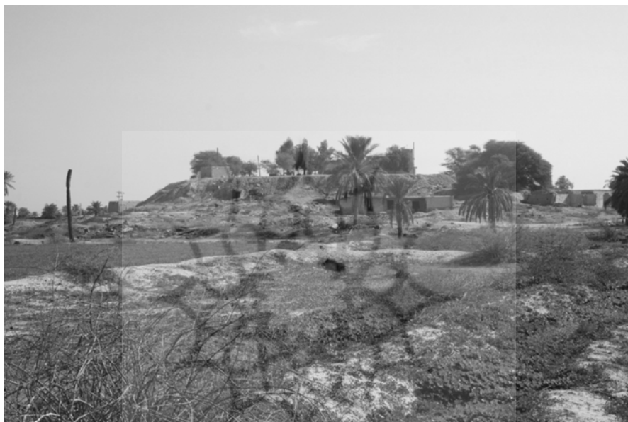
نمای جنوب غربی تپه حسینیه